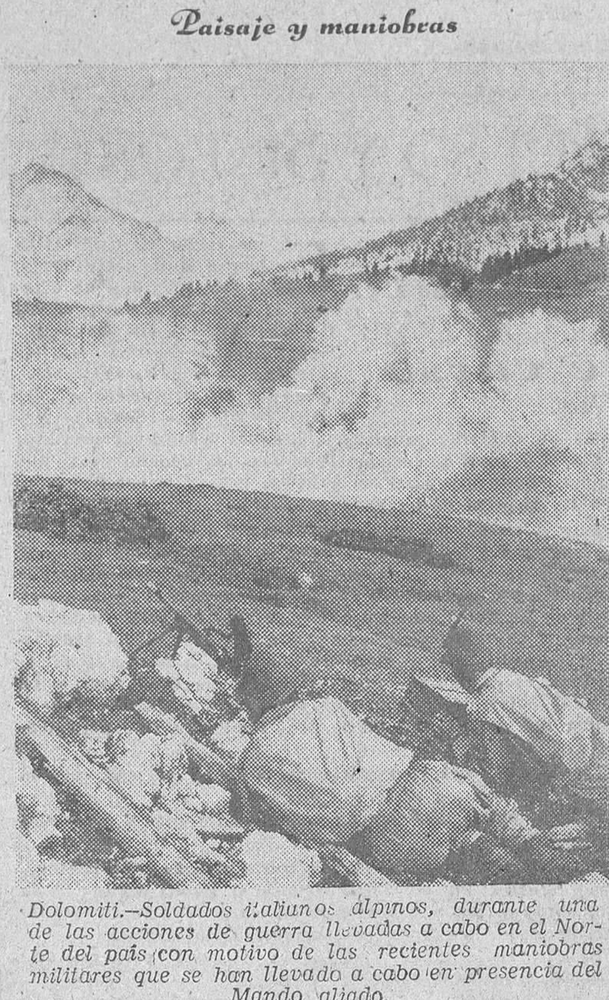
Dolomiti.—Soldados italianos alpinos, durante una de las acciones de guerra llevadas a cabo en el Norte del país con motivo de las recientes maniobras militares que se han llevado a cabo en presencia del Mando aliado.