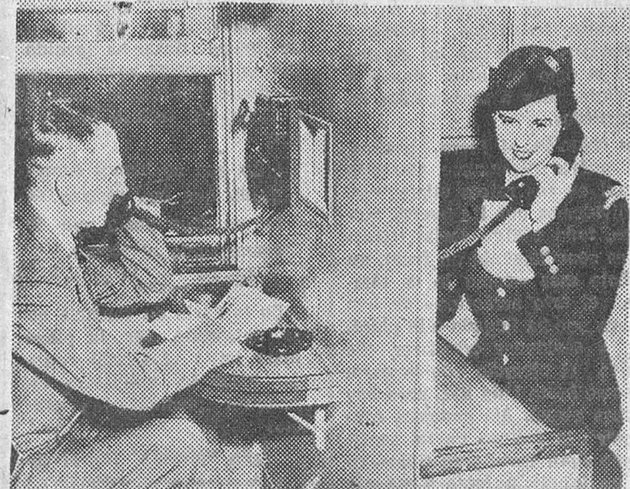
Un hombre de negocios utiliza un radiotelefono instalado en un tren. La señorita encargada ayuda a establecer la conexión con cualquier telefono de los Estados Unidos.

dar. «Un minuto después —refería más tarde el médico— me encontraba examinando a una mujer que padecía una peligrosa apendicitis. Al cabo de una hora ya estaba operada. Podía haberle costado la vida si me hubiera ido primero a la oficina».