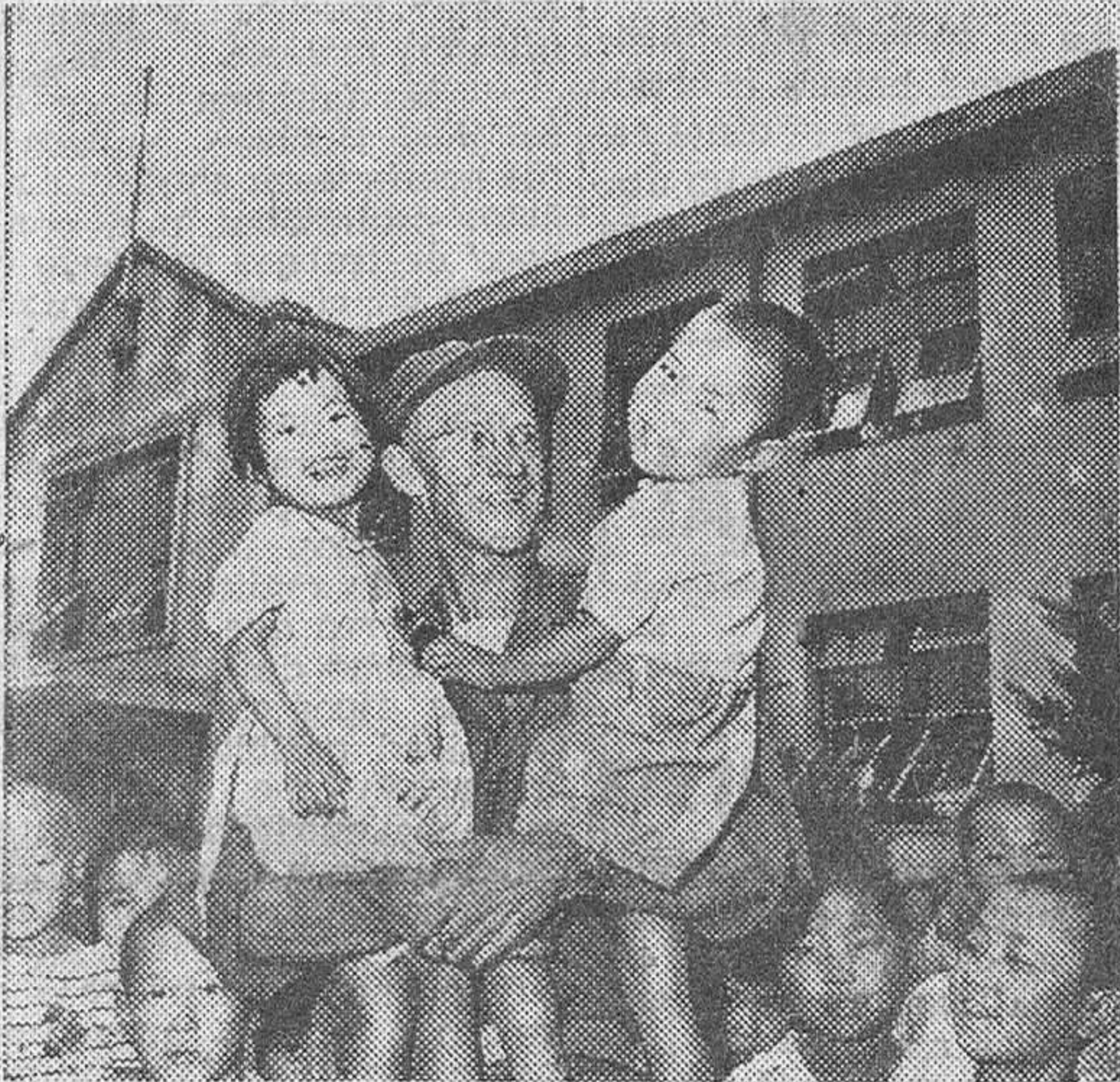
Un funcionario de la Cruz Roja norteamericana, destinado a un Orfanato de Seul, con dos niños huérfanos coreanos acogidos en la institución.