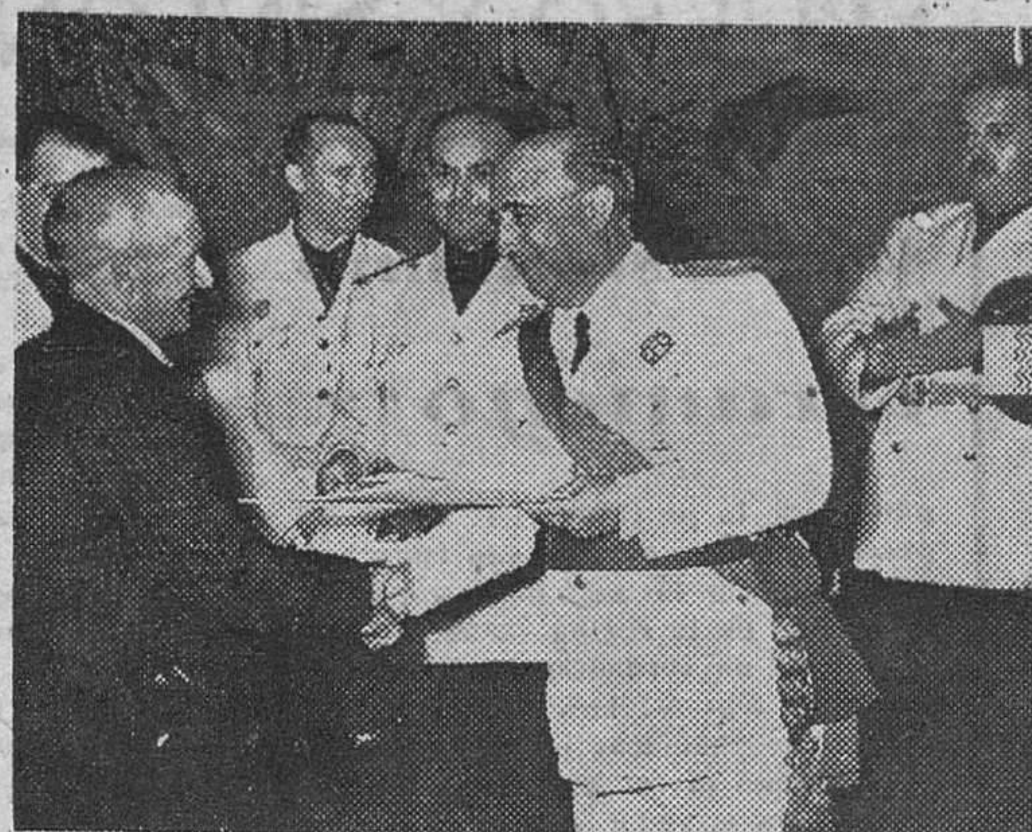
MADRID.— Su Excelencia el Jefe del Estado estrecha la mano a un obrero ejemplar en el acto de la entrega de diplomas, celebrado con motivo de la fiesta de Exaltación del Trabajo.