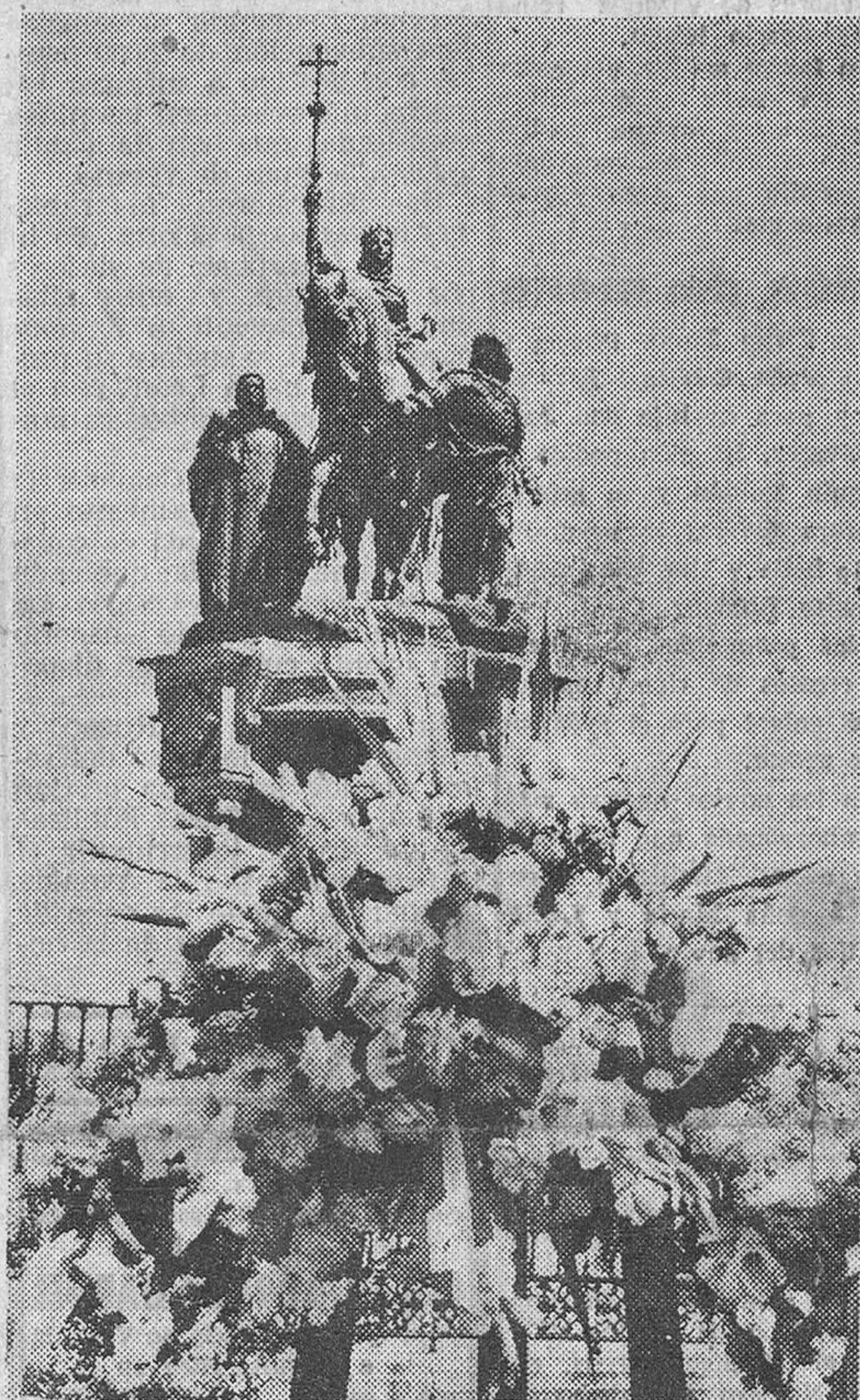
Aspecto que ofrecía el monumento levantado en la Castellana a Isabel la Católica después de la ofrenda de una corona de flores que le hizo el comandante del buque-escuela argentino "Puyredón", a presencia del alcalde de Madrid, miembros de la Embajada argentina y varios jefes de la Armada española.