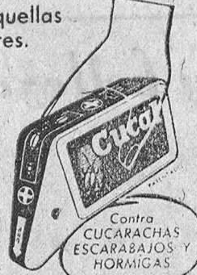
Contra CUCARACHAS ESCARABAJOS Y HORMIGAS