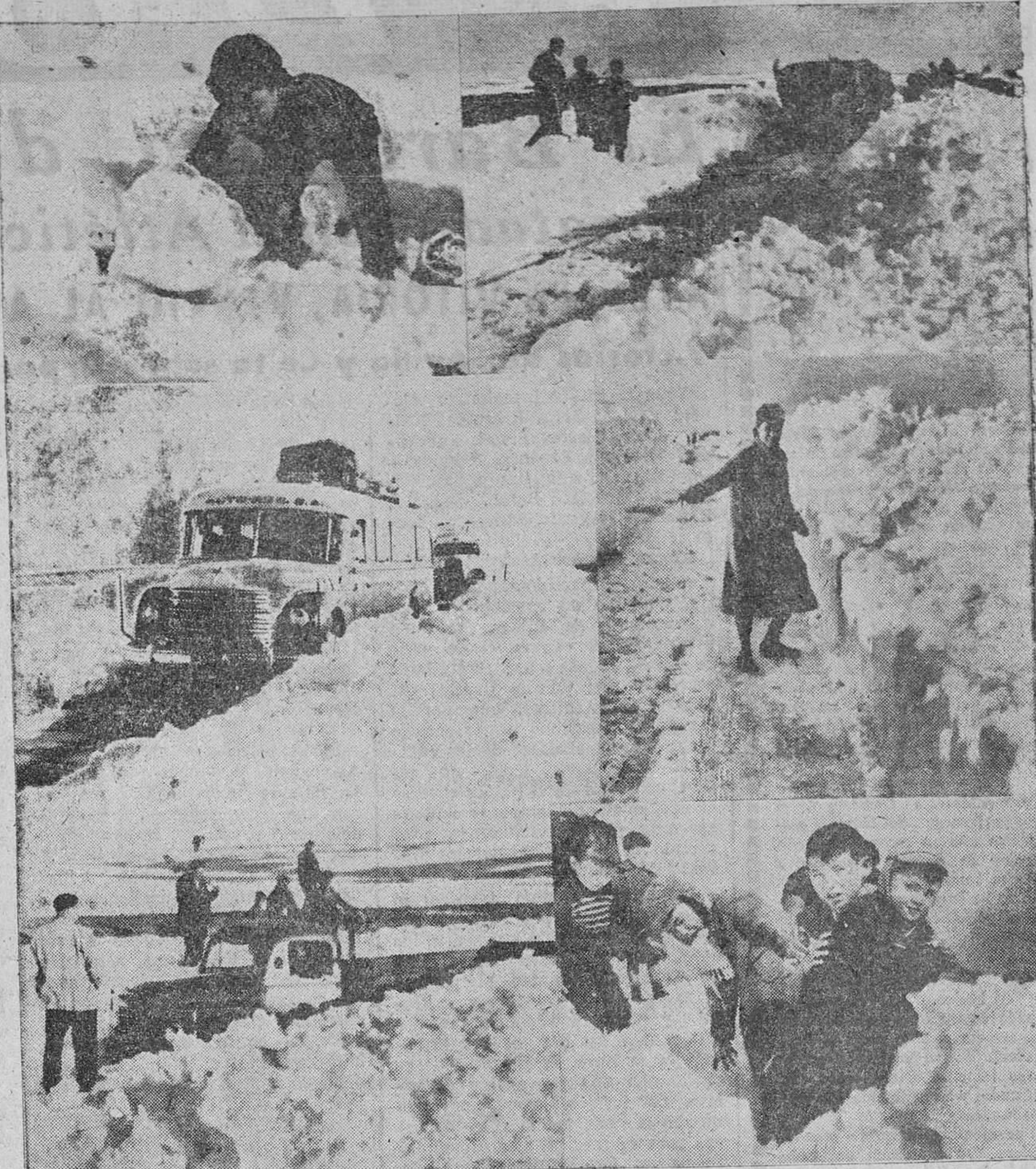
El temporal de nieve sufrido la pasada semana bloqueó la mayor parte de las comunicaciones de Zamora con la provincia. En esta gráfica de Juanes vemos el estado de la carretera Zamora-Puebla de Sanabria después de esforzados trabajos, realizados en su mayor parte por iniciativa de las autoridades locales y vecindarios para abrir paso por ventisqueros donde la nieve tiene todavía hasta dos metros de altura.

En España se está trabajando también para la obtención de la vacuna. Pero estos trabajos son únicamente de tipo experimental y no industrial. Mientras para su fabricación sea necesario utilizar los monos, la obtención de la vacuna tendrá un precio muy elevado. Se están haciendo ensayos sobre el embrión del pollo y éste sería el camino para su abaratamiento. Se trabaja en España sobre los monos. Los trabajos de experimentación se hacen en la Escuela Nacional de Sanidad. — Gifra.