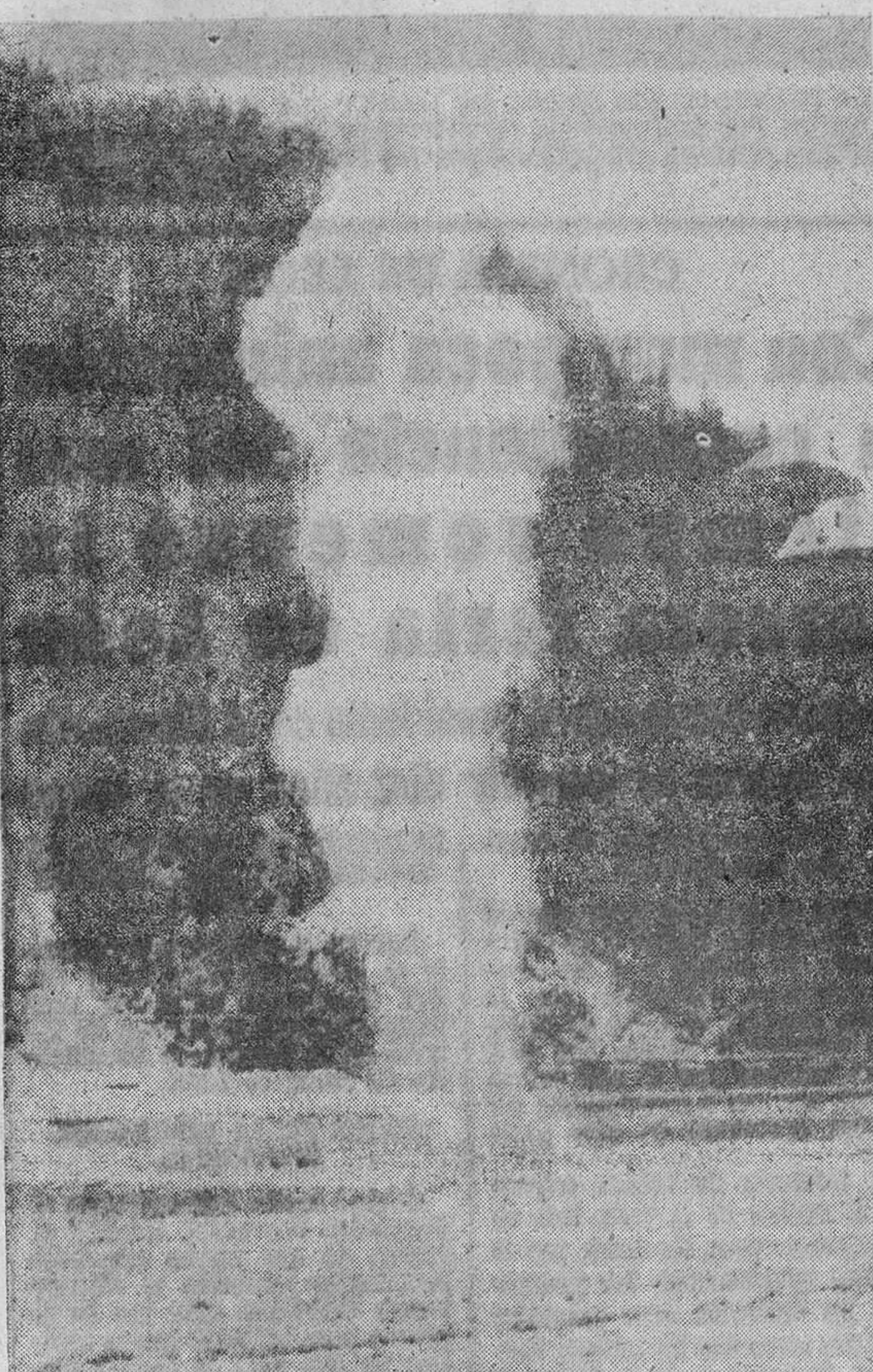
Las aguas del Danubio, bloqueadas por enormes masas de hielo, tienen que ser ayudadas en su plácido discurrir de "río divino" por potentes cargas de dinamita que se hacen explotar en puntos esencialmente estratégicos para favorecer la vuelta a la normalidad de la política corriente que, como ya se sabe, oscila entre los colores rojo y azul.