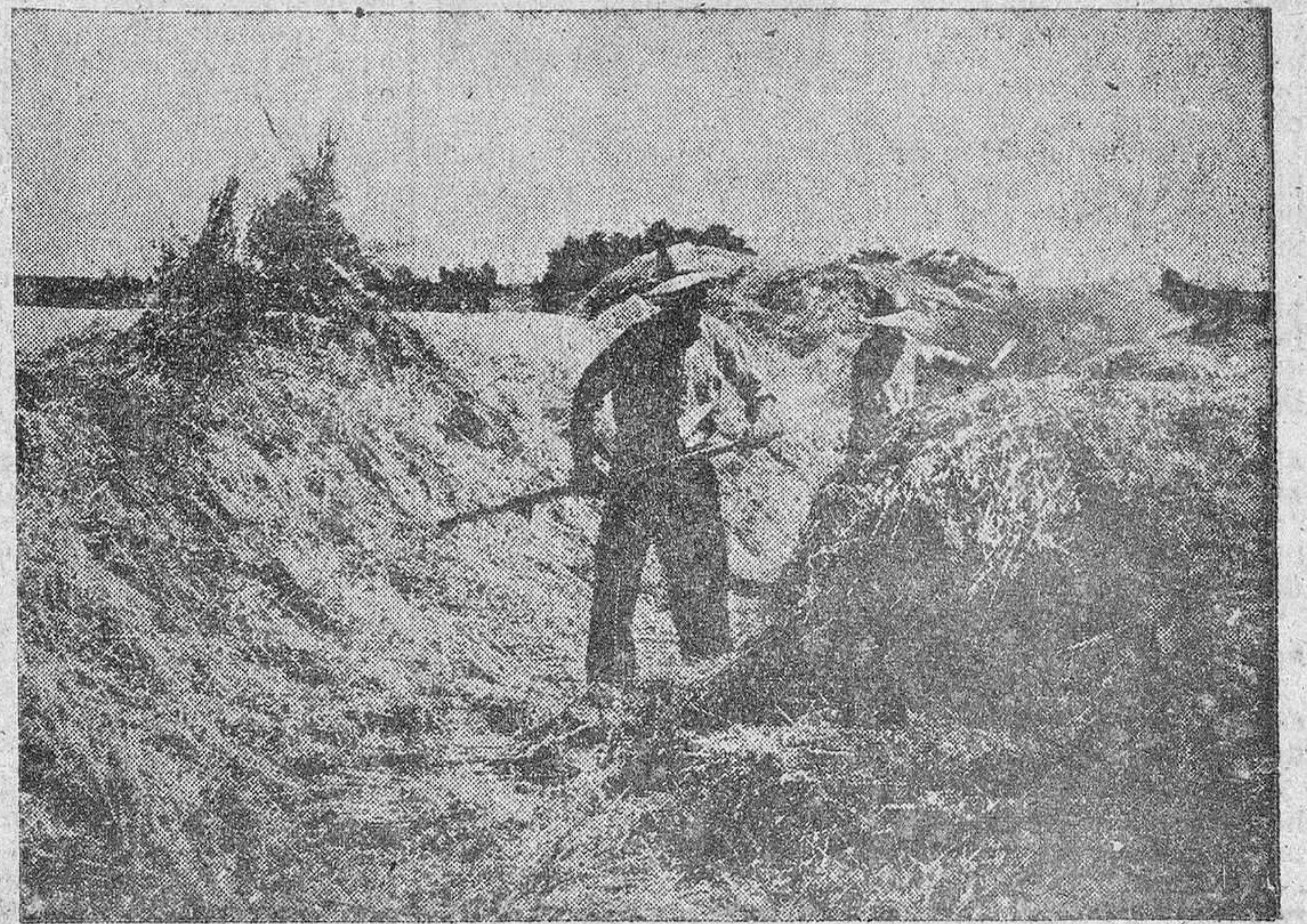
Se cuida y protege con el laboreo y arbolado adecuado a este fin.

Es un nuevo aspecto de la vigilancia agraria que ha alcanzado gran interés e intensidad en estos últimos tiempos, para preservar el suelo de las erosiones que lo debilitan y empobrecen. Un plan general de acción, reflejado en una empílica y resonante campaña de carácter nacional, está comenzando a dar sus frutos, pues los agricultores se disponen a luchar contra esa amenaza que hiende y aniquila las tierras, llamadas a ser ubérrimas si se