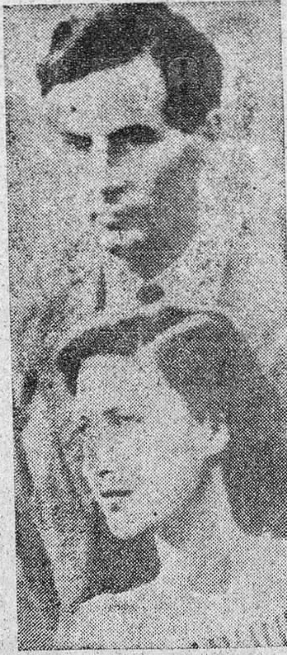
TOWNSEND Y MARGARITA