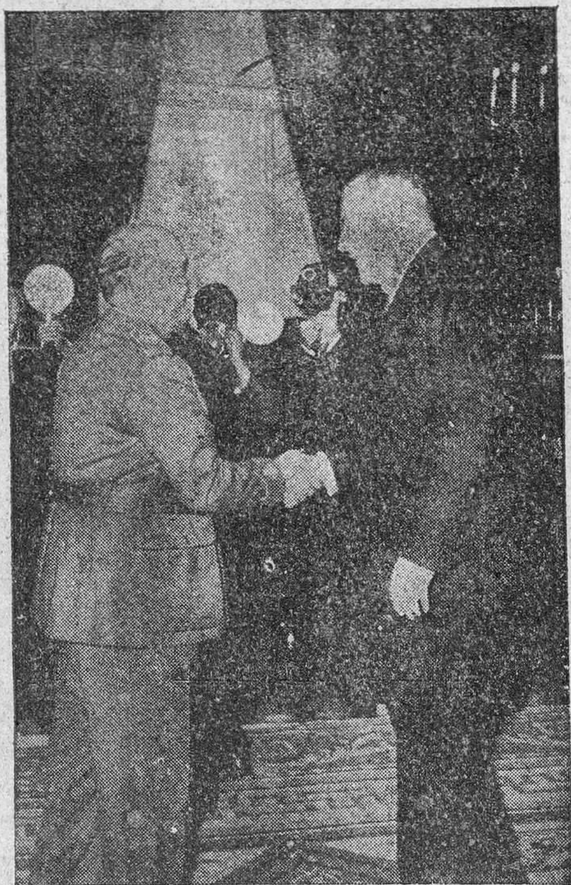
ENTREVISTA FRANCO-DULLES.—Su Excelencia el Jefe del Estado recibe la visita del secretario de Estado norteamericano, Foster Dulles, como se recordará, una rápida visita a El Pardo, volando desde Ginebra.

EL año 1954, cuando de él hicimos diagnóstico y resumen, permitió decir que había sido el de la continuidad y el éxito, tanto en la política interna de España como en la proyección de España hacia el exterior. Respecto del transcurrido 1955 puede decirse algo más. Las anteriores consecuencias se consolidan. El mundo reconoce ya en plenitud las razones que abonan un sentido de justicia. Llegan las rectificaciones o se afirman las que antes se produjeron. En alusión más pormenorizada me referiré a las visitas de ministros españoles a naciones extranjeras, atendiendo a requerimientos oficiales, testimonio de amistad, expresión del sincero, ferviente deseo de buscar y frecuentar los acercamientos. Otra prueba, inequívoca, que alcanzó caracteres de episodio trascendente, la visita al Caudillo de Mr. Foster Dulles. Y, finalmente, la admisión, con una sola abstención y ningún voto en contra, en el seno de las Naciones Unidas. Todo ello, reflejado ampliamente en la Prensa universal, ha sido la feliz consecuencia de haber sabido mantener una posición entera, gallarda, de inexorables firmezas.