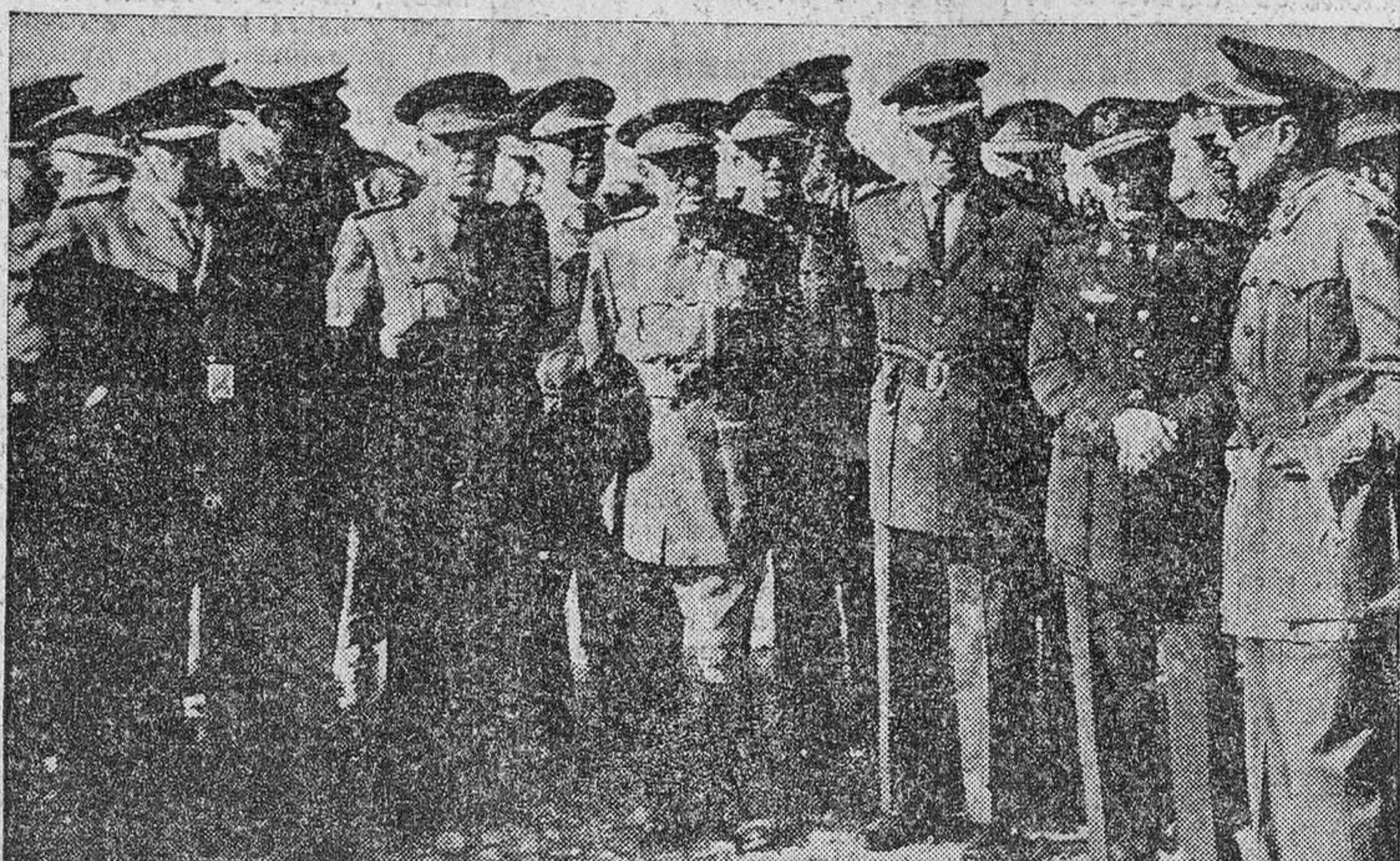
El ministro del Ejército, excelentísimo señor teniente general don Agustín Muñoz Grandes, presencié ayer, en Valladolid, unas importantes maniobras antiáreas, con concentración de mandos de artillería antiárea llevados de casi toda España y a las cuales han acudido también otros prestigiosos militares. El supuesto táctico se realizó con el mayor de los éxitos, —consistía en la defensa de la capital y su zona industrial—, y durante su desarrollo se hizo esta fotografía del ministro rodeado de los jefes militares que presenciaron e intervinieron en tan brillantes maniobras.