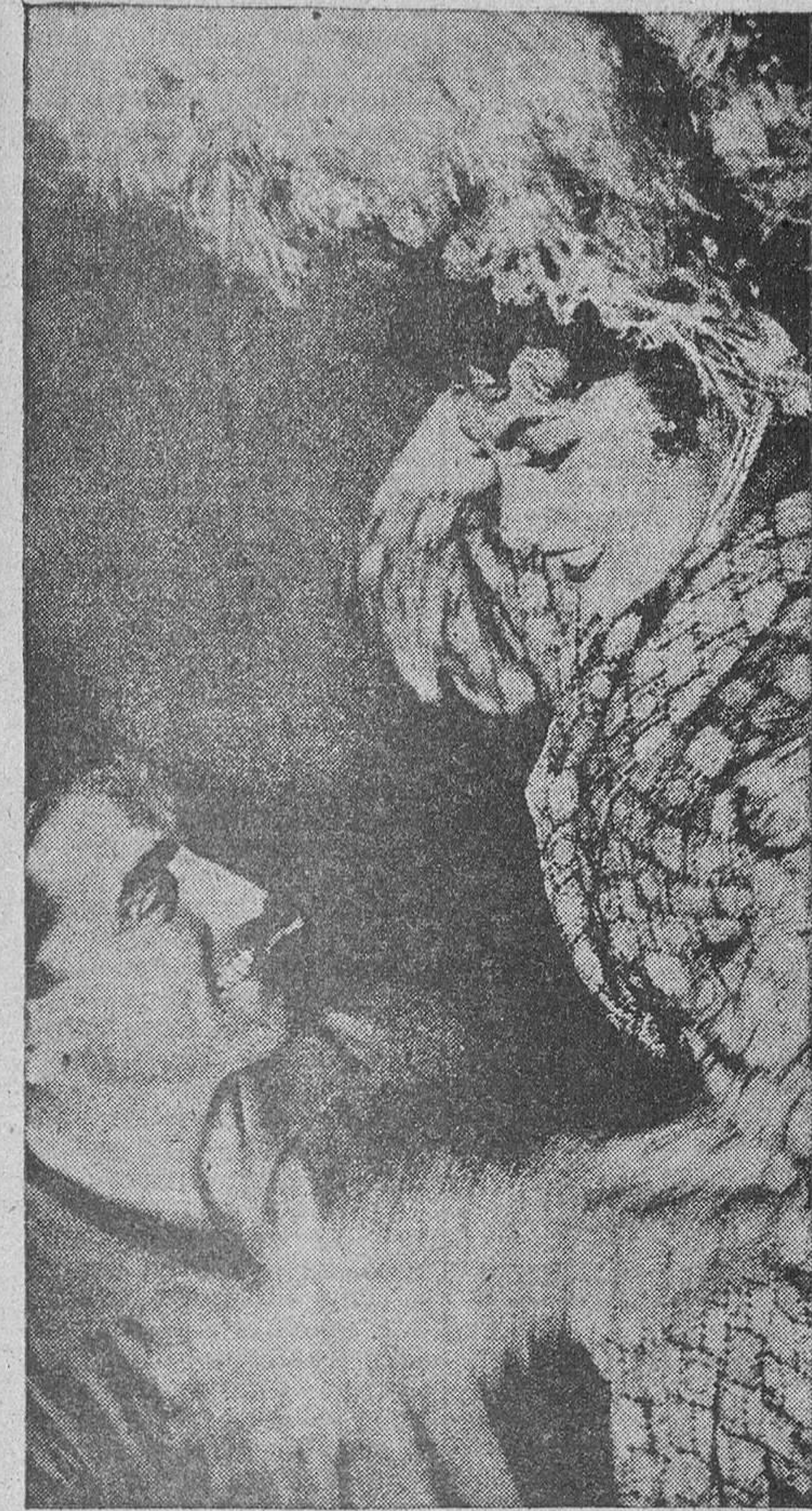
Gina Lollobrigida, vestida para el rodaje de una escena de "La mujer más bella del mundo", sobre la vida de Lina Cavallieri.