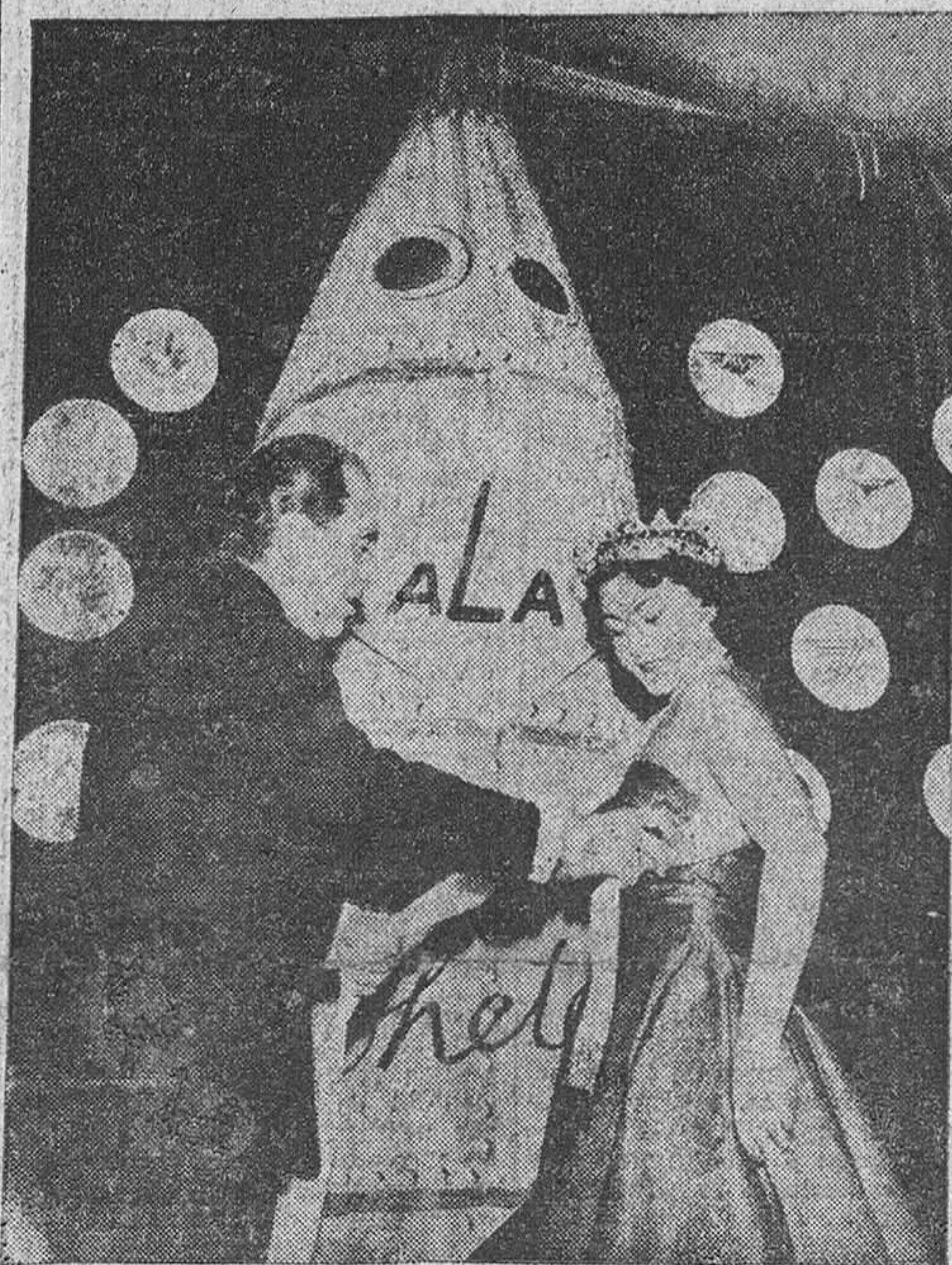
Madrid.—Durante una agradable fiesta nocturna organizada por las compañías de aviación, fué elegida esta "Reina de las Líneas Aéreas", digna del título por su belleza y simpatía.