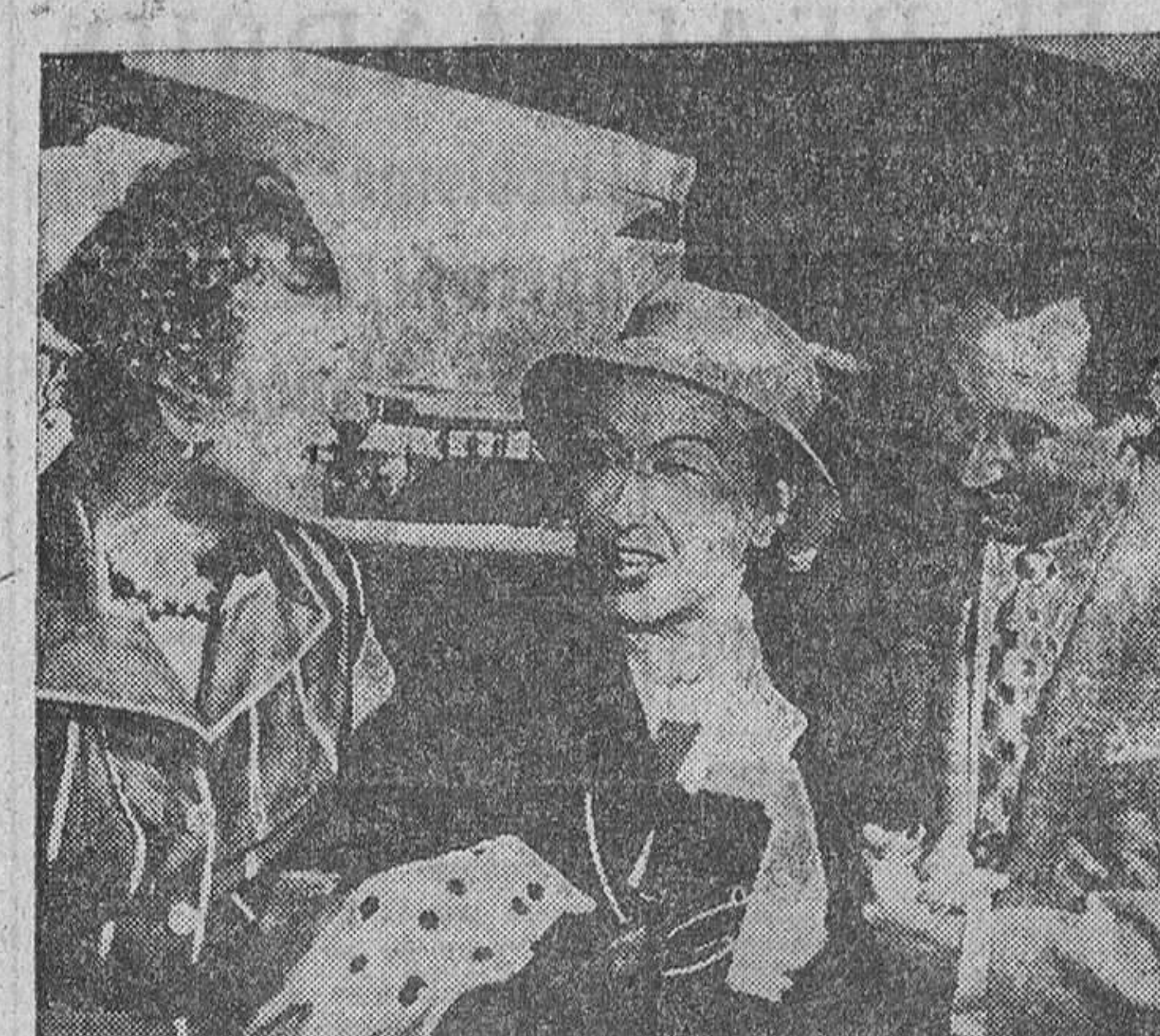
Gloria Swanson a su llegada a Barajas.

—Veamos, señor —le respondió el peluquero—; yo desearía que se diera usted cuenta de una vez lo que sufro cuando voy al cine. Antes de comenzar la película me presenta usted el reparto con una lista inter-