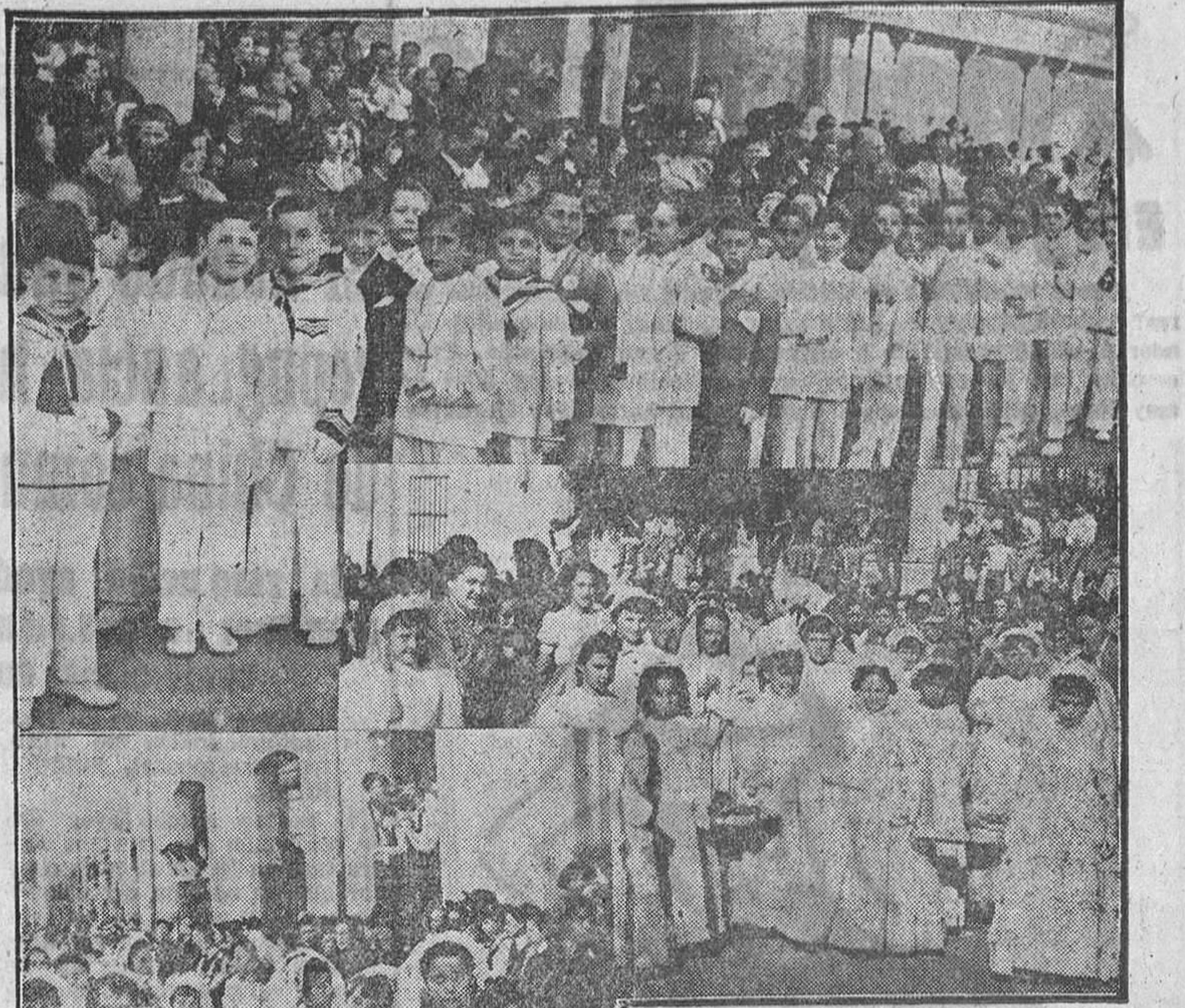
Gráfico del Corpus zamorano Según informamos ayer, la procesión del Corpus Christi revisitó este año un inusitado esplendor. En las presentes gráficas aparecen los niños que se acercaron por primera vez a la Santa Mesa, y que tomaron parte en la procesión, vestidos con sus inmaculados trajes blancos. Las otras fotografías recogen diversos momentos de la procesión con la presencia de las dignidades y autoridades eclesiásticas.

NOTA. Además de los números expresados en esta lista, han sido agraciados con el reintegro de 250 pesetas cada uno, todos los billetes que terminan en 8, a excepción del que ha obtenido el premio mayor