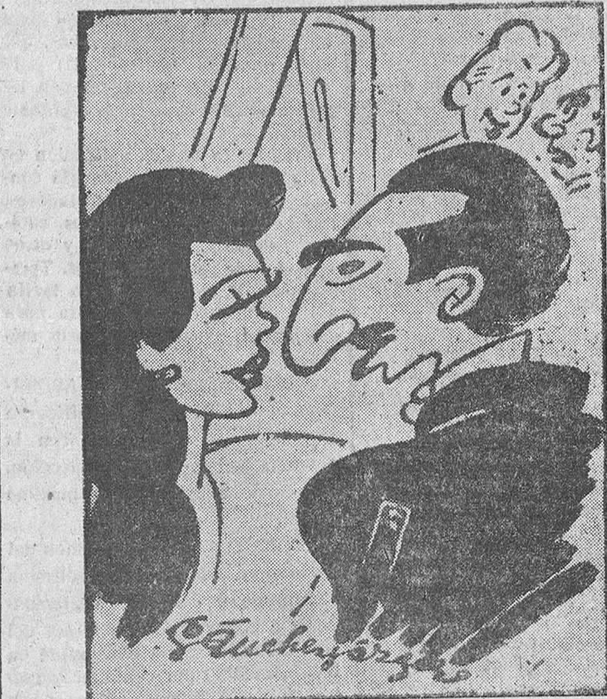
—Es horriblemente charlatana. No te digo más sino que una vez fué a la playa a tomar el sol y cuando volvió a su casa tenía la lengua tostada.

—¿Con cuántos asociados cuenta actualmente el Atlético? —Con 1.200 aproximadamente, a