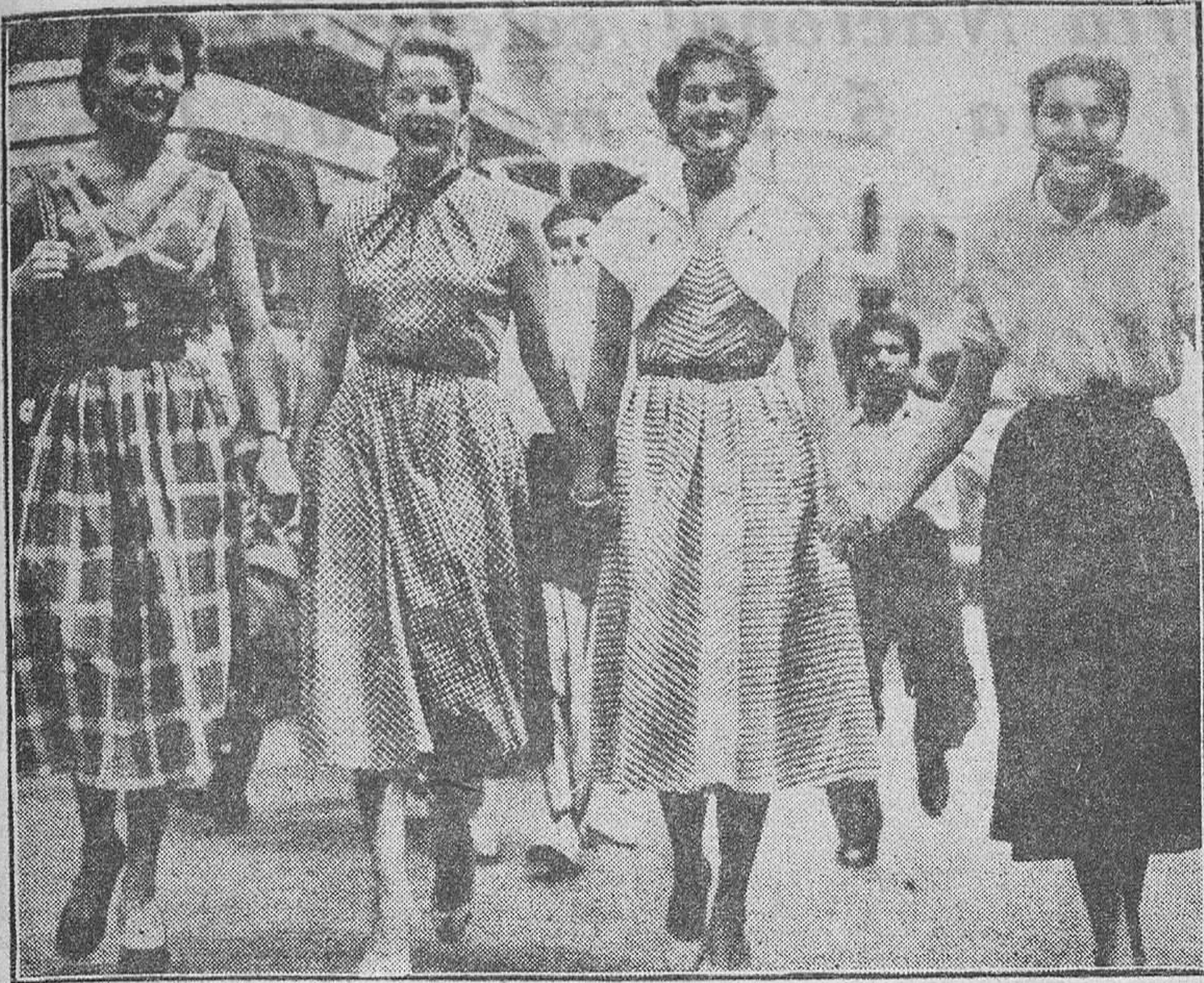
La ciudad de Bagdad ha sufrido durante estos últimos días la agradable presencia de unas cuantas bellezas, dedicadas a saturar el ambiente de todo el Oriente Medio con las primicias de la moda femenina de primavera. Las modelos captadas por el fotógrafo son nada menos que las reinas de la belleza de Hispanoamérica, de la Riviera, de Finlandia y de París. ¡Así ya se puede!..