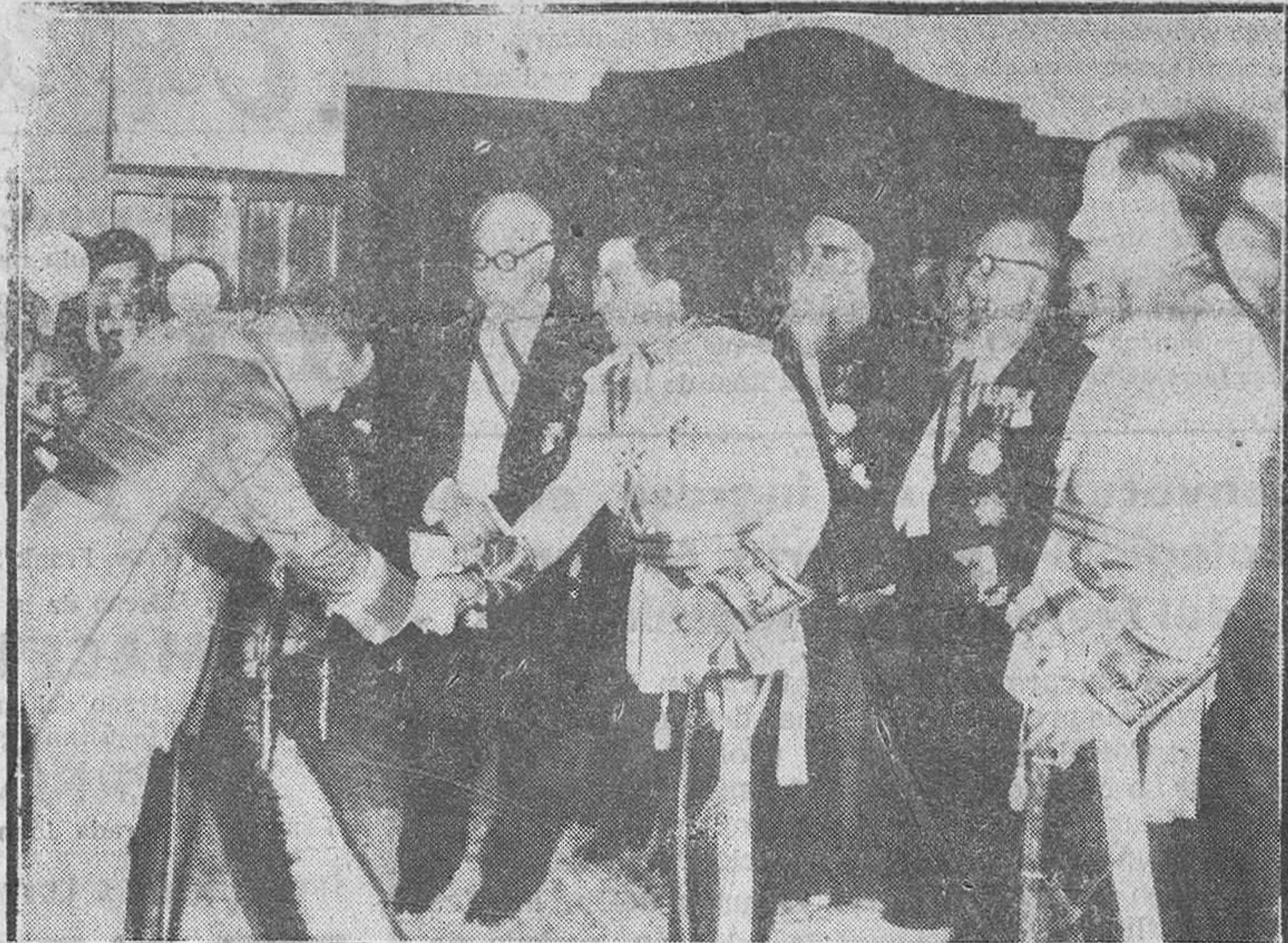
BAGDAG—El capitán general de Cataluña, teniente general Bautista Sánchez, representante español en la coronación del joven rey del Irak, celebrada en el Parlamento, saluda a éste, que se halla acompañado de los ministros de su Gobierno y del hasta ahora príncipe regente, Abdul Ilah.