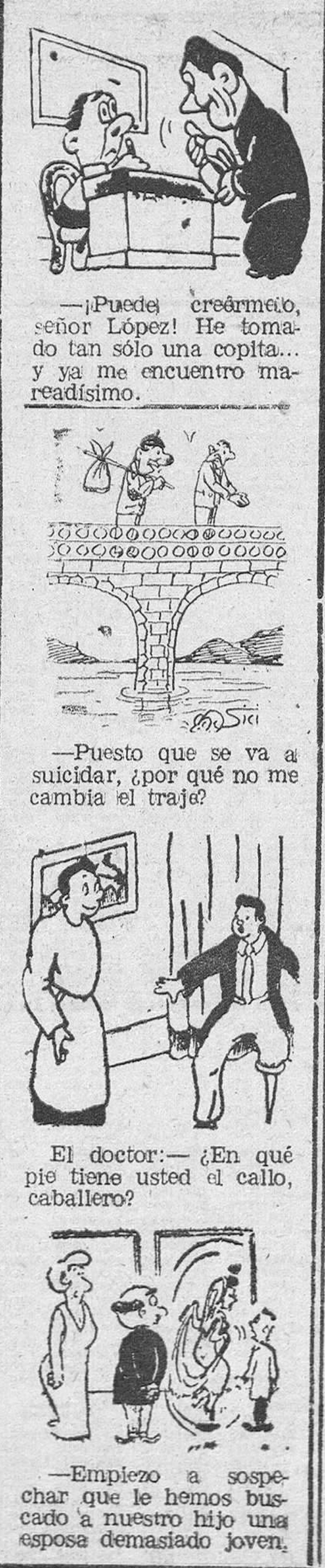
El doctor: —¿En qué pie tiene usted el callo, caballero?