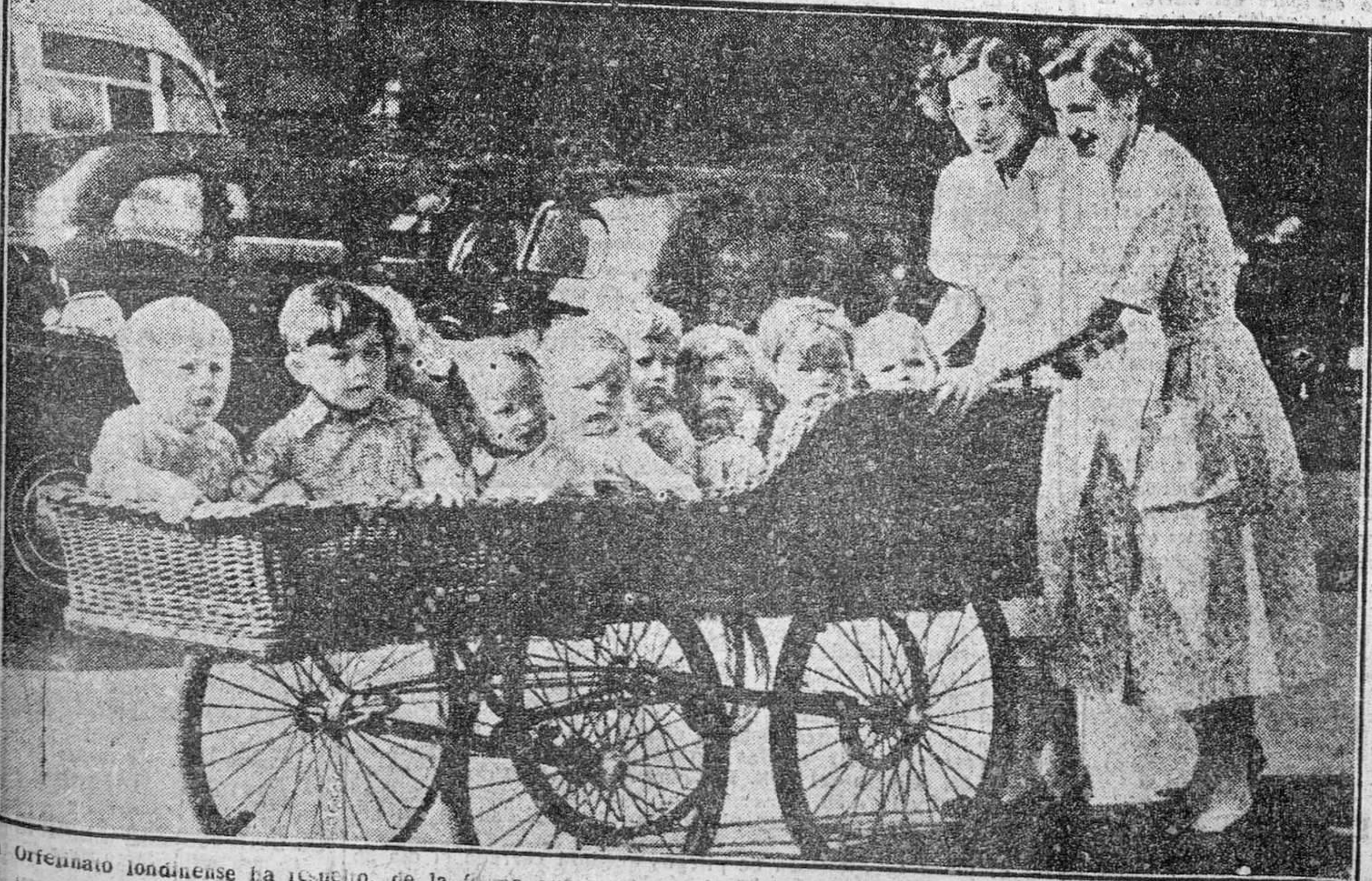
Un Orfeón londinense ha resuelto, de la forma que puede verse en la "foto", el problema de sacar de paseo a los chiquillos que aiberga. El procedimiento es original, pero no demasiado cómodo.