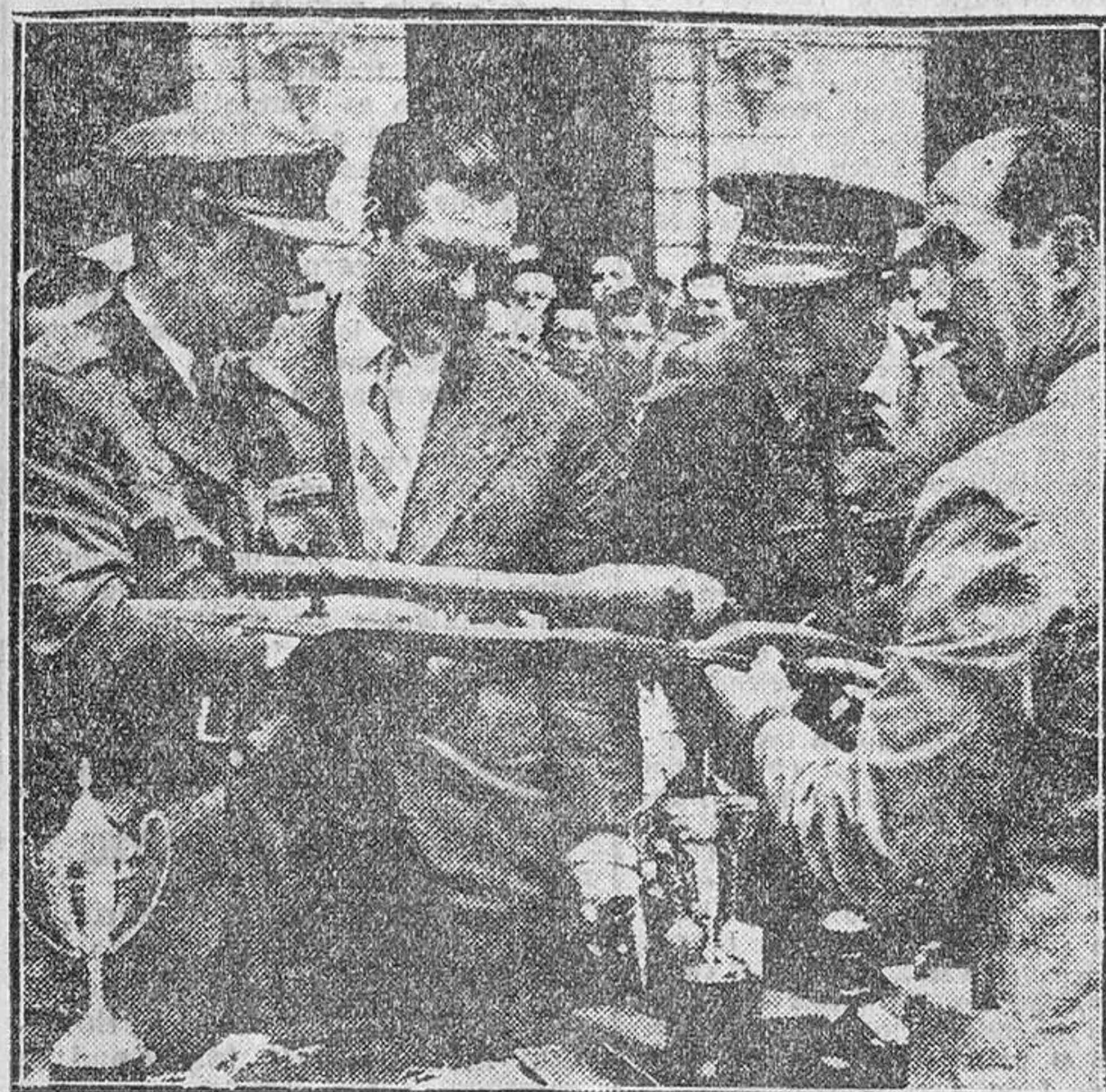
Las autoridades coruñesas contemplan un aeromodelo a reacción presentado en el Concurso Nacional celebrado en la Plaza de María Pita, de la capital gallega. El pequeño prodigio aeronáutico ha sido la "vedette" del Concurso.