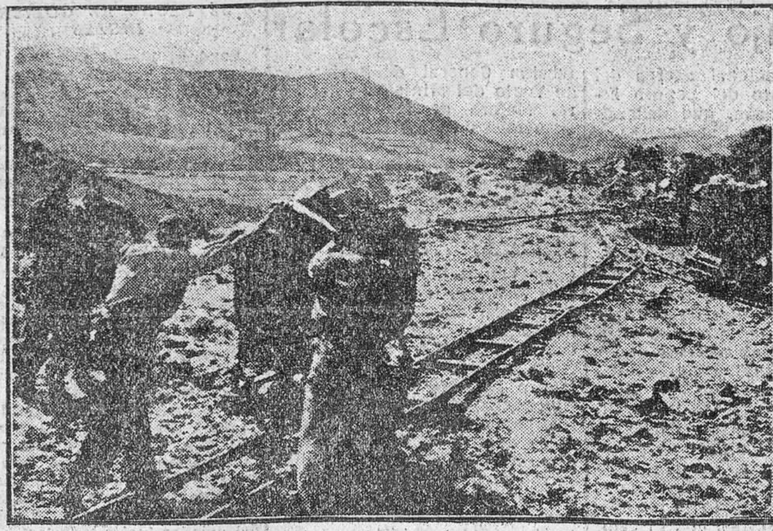
Estudiantes y obreros, en la hermandad del trabajo, realizan los desmontes para una línea férrea.

Hacen maravillosa realidad la convivencia con los trabajadores