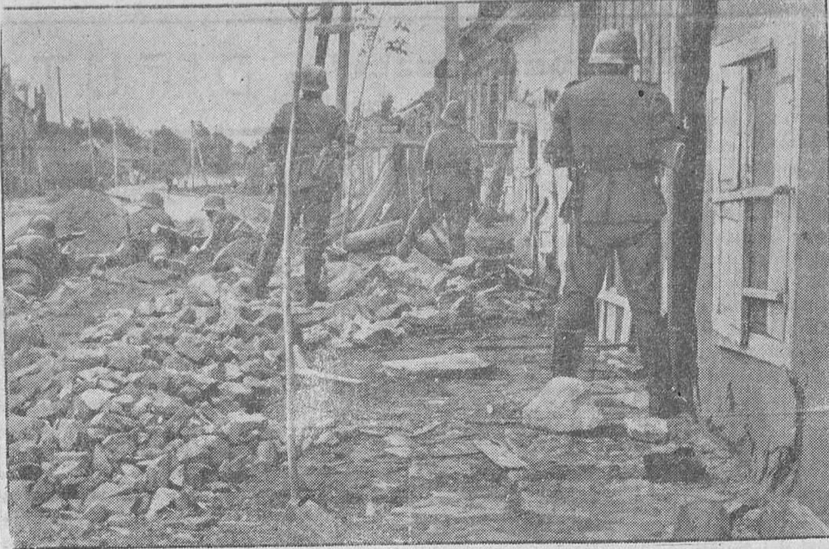
Avanzadilla alemana en una pequeña ciudad rusa

Vichy, 20.—El mariscal Pétain saldrá el domingo por la noche en dirección a Saboya, en tren especial. El lunes llegará a Chambery, donde