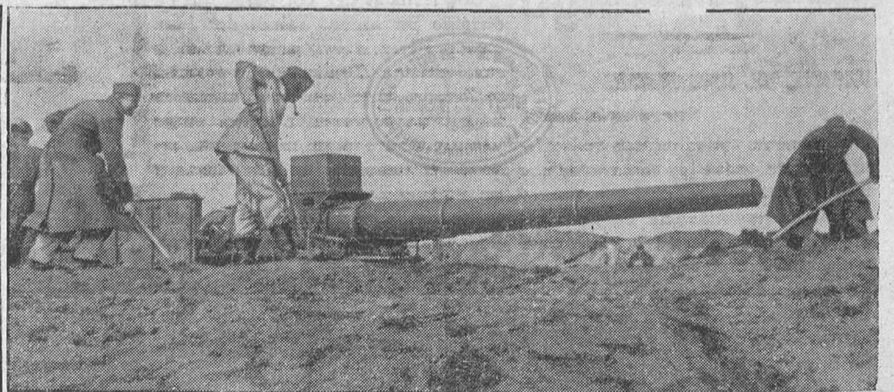
Zapadores alemanes preparan el terreno para una batería en las costas del Mar Negro. Antes de estar terminada la intalación, los cañones están en disposición de tiro.

La flota soviética sufre importantes pérdidas