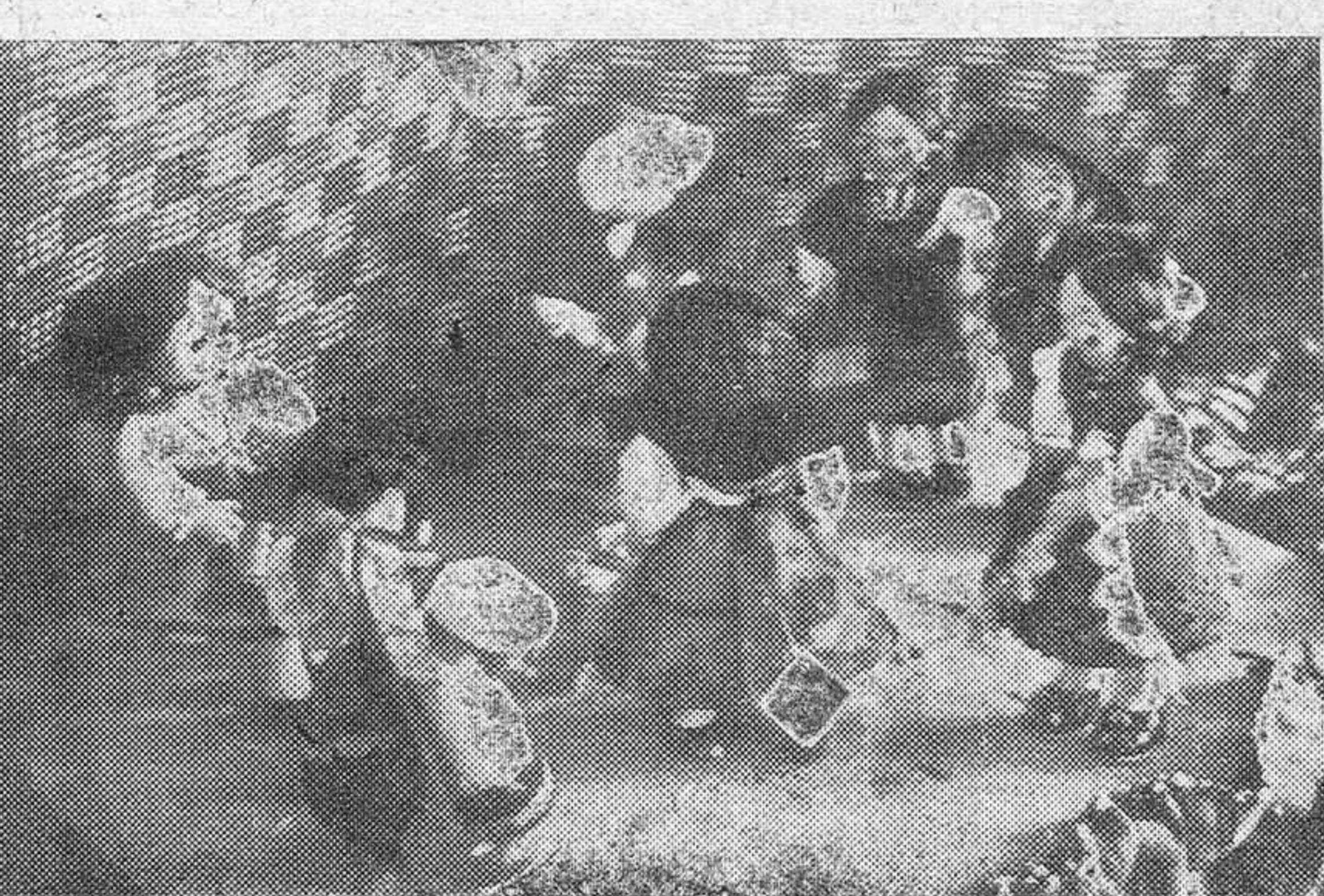
La feria zamorana de los ajos.