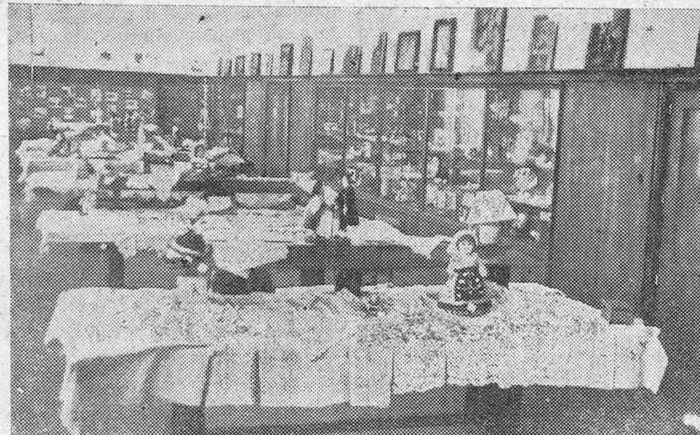
Vista de la exposición de trabajos de concursos.

Y A se encuentran en Madrid las ocho mil chicas que en representación de sesenta y una diócesis de España se unirán a las siete mil de la de Madrid-Alcalá para participar en los actos conmemorativos del XXV aniversario de las Jóvenes de Acción Católica. Anoche llegaron en un autocar medio centenar de muchachas de la diócesis de Zamora y, aproximadamente a la misma hora, lo hicieron otras cincuenta jóvenes benaventanas. Las de Zamora han sido alojadas en una residencia de las Siervas de San José, mientras que las de Benavente se han distribuido entre varias pensiones.