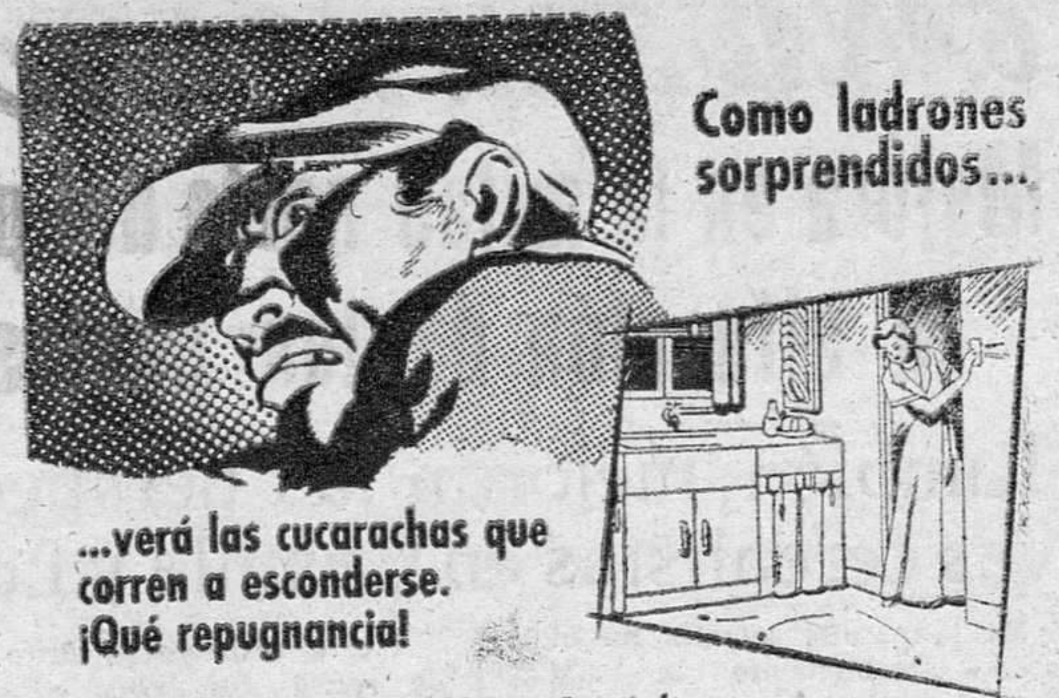
Como ladrones sorprendidos...

...verá las cucarachas que corren a esconderse. ¡Qué repugnancia!