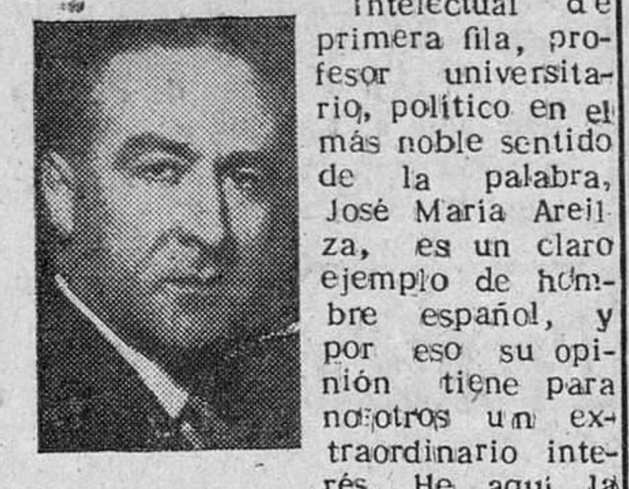
contestación de José María Arellano, conde de Motrico, a nuestra pregunta.

Intelectual de primera fila, profesor universitario, político en el más noble sentido de la palabra, José María Arellano, es un claro ejemplo de hombre español, y por eso su opinión tiene para nosotros un extraordinario interés. He aquí la