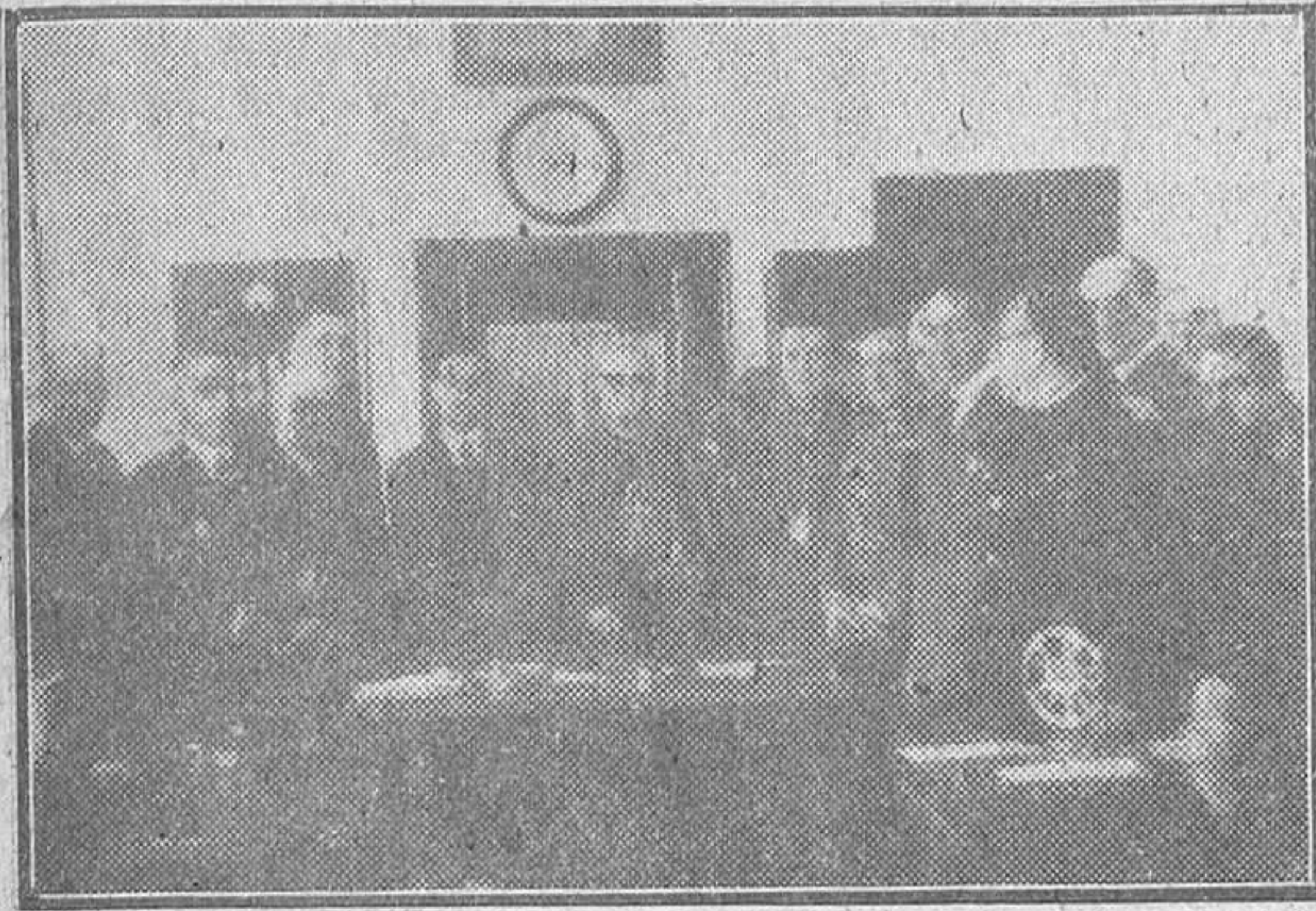
En la sala de aparatos de Telégrafos fué obtenida esta fotografía momentos después de efectuarse la puesta en marcha. Con el prelado de la Diócesis se encuentran los directores generales de Correos y Sanidad, el gobernador civil, el gobernador militar el jefe de Telégrafos de Zamora y otras autoridades y personalidades

Pronunciaron discursos los directores generales de Sanidad y de Telecomunicación