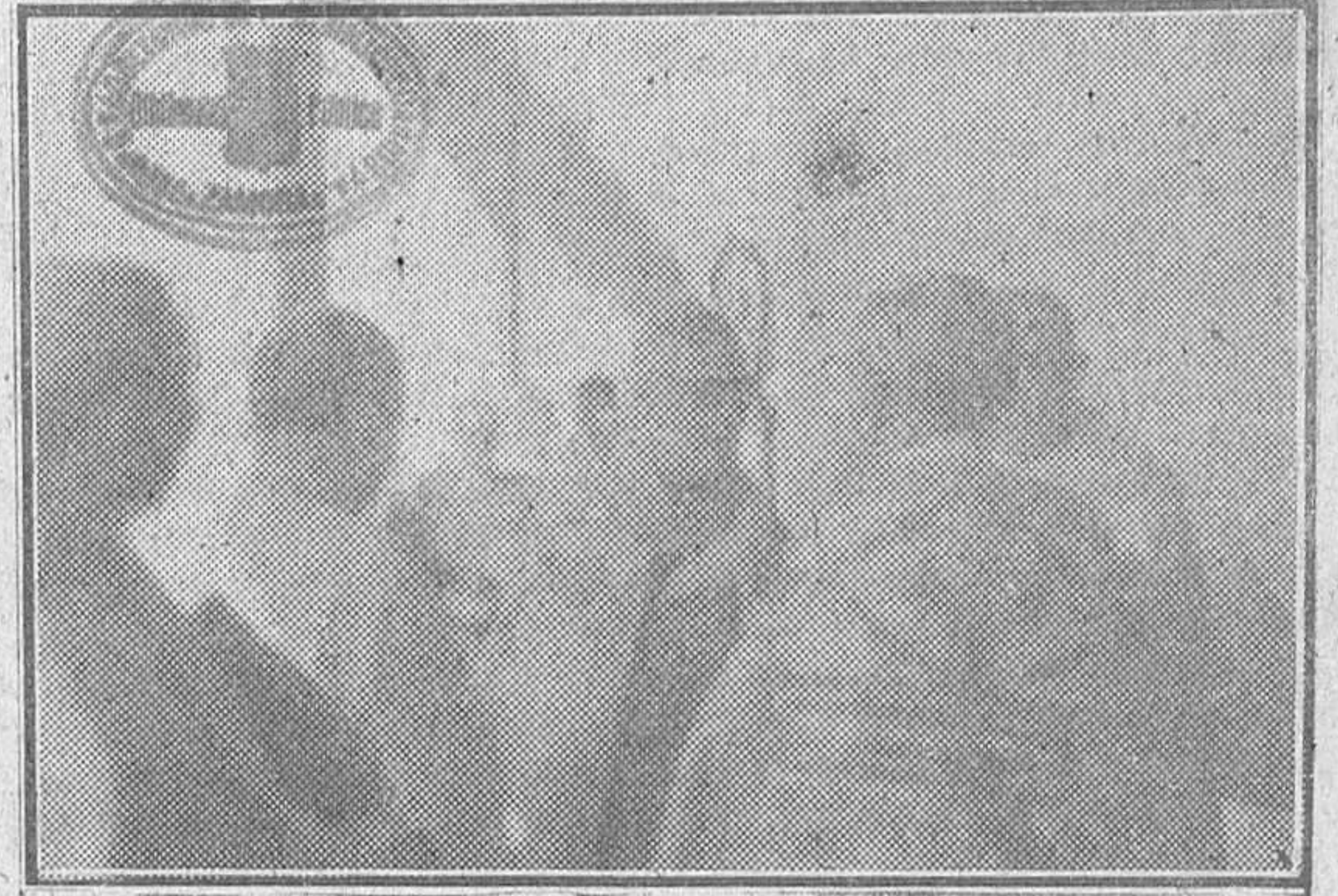
El excelentísimo e ilustrísimo señor obispo de la Diócesis doctor don Jaime Font Andreu, ayudado por canónigos y beneficiados de la Santa Iglesia Catedral ofició en la solemne bendición del nuevo pabellón del Sanatorio Antituberculoso.

Antes de abandonar el edificio se reunieron todas las autoridades en una de las más espaciosas salas del (Sigue en 3.ª página 1.ª columna)