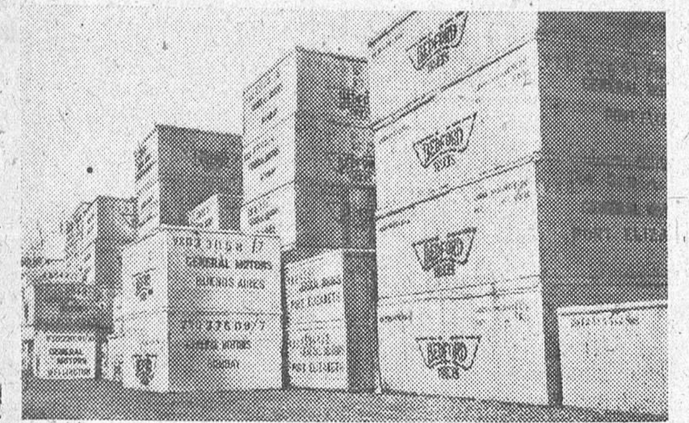
La industria del automóvil está jugando un importante papel con el impulso de sus exportaciones a los mercados extranjeros. En esta fotografía recogemos un grupo de cajas que contienen secciones de coches listas ya para la exportación.