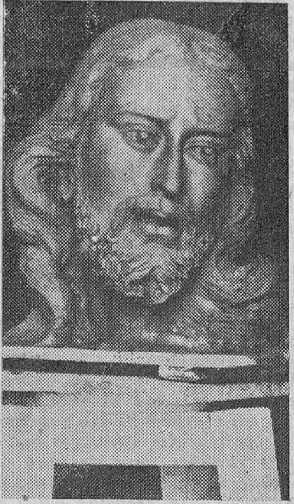
Copia de la cabeza del Cristo de La Calda obra de Julio Antonio Mostajo.