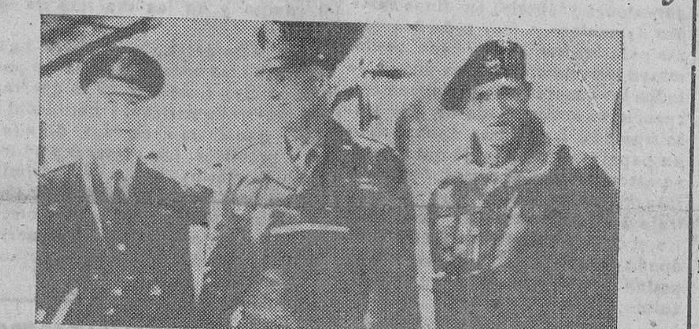
El general Eisenhower, jefe supremo del Cuerpo Expedicionario Aliado, conferencia con el Almirante Sir Bertram Ramsay y el general Montgomery, a bordo de un buque de guerra inglés