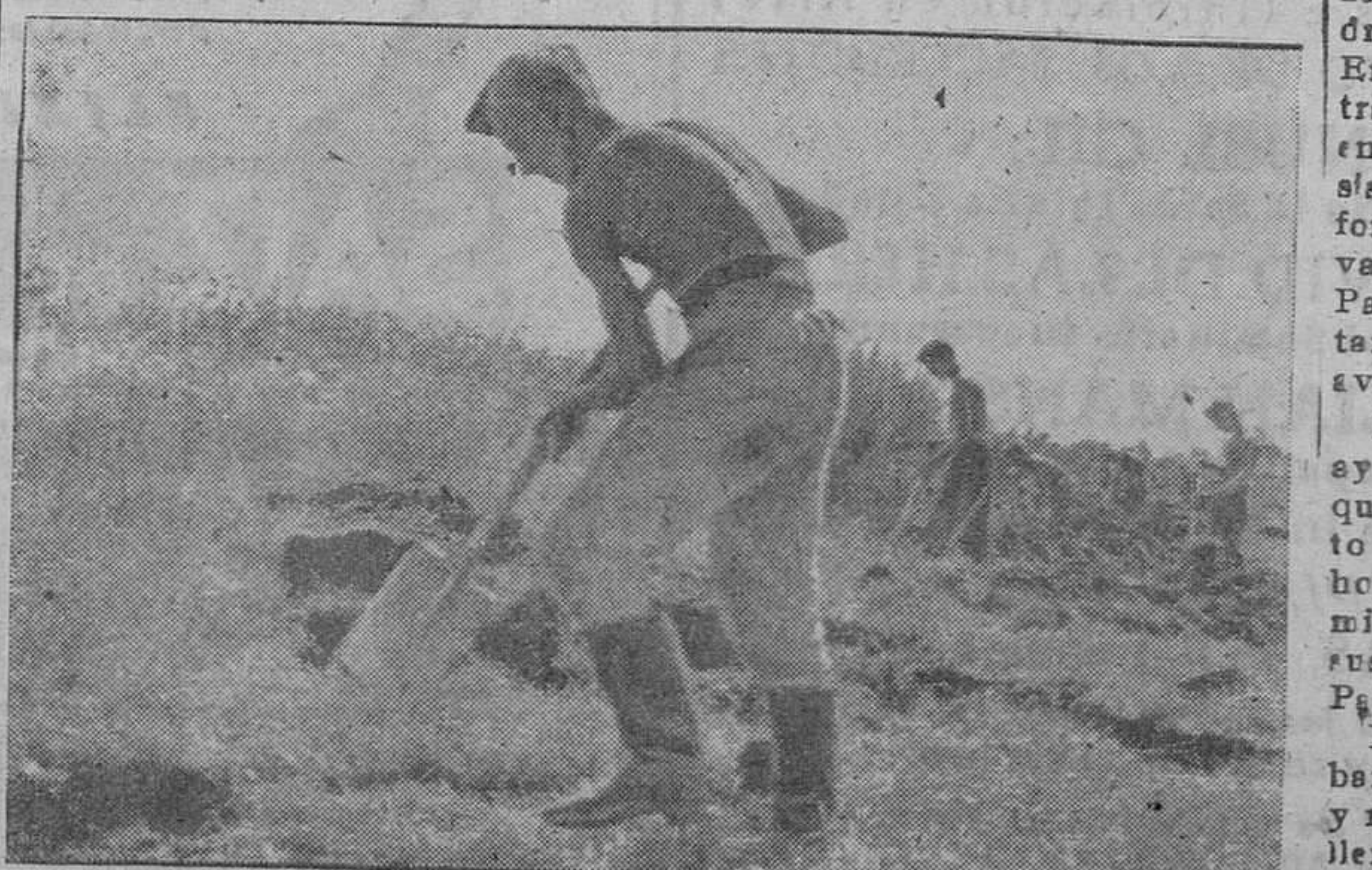
Los muchachos del Servicio de Trabajo alemán ayudan en la construcción de barreras y fortificaciones en la Prusia Oriental.]]