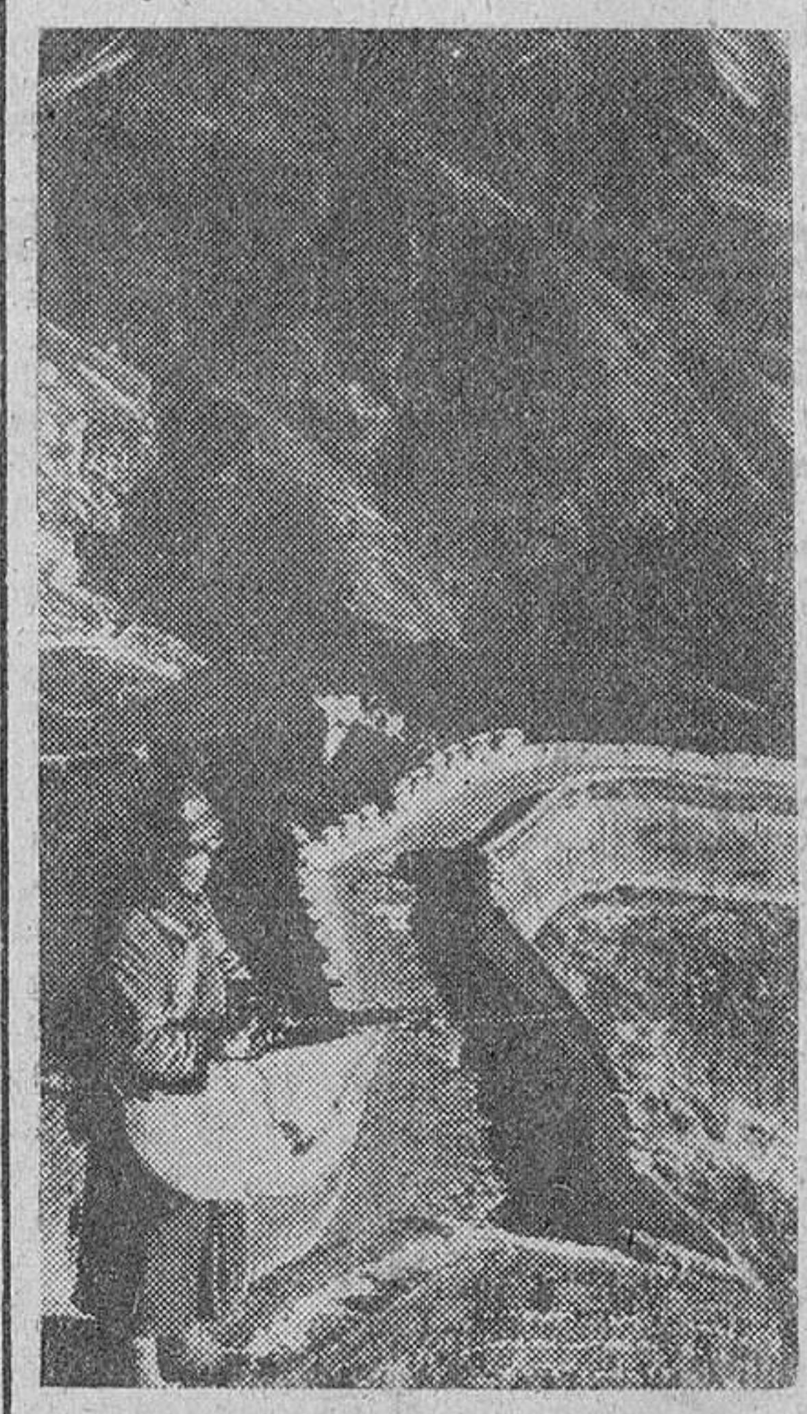
Un soldado japonés de guardia en la muralla china al norte de aquel país