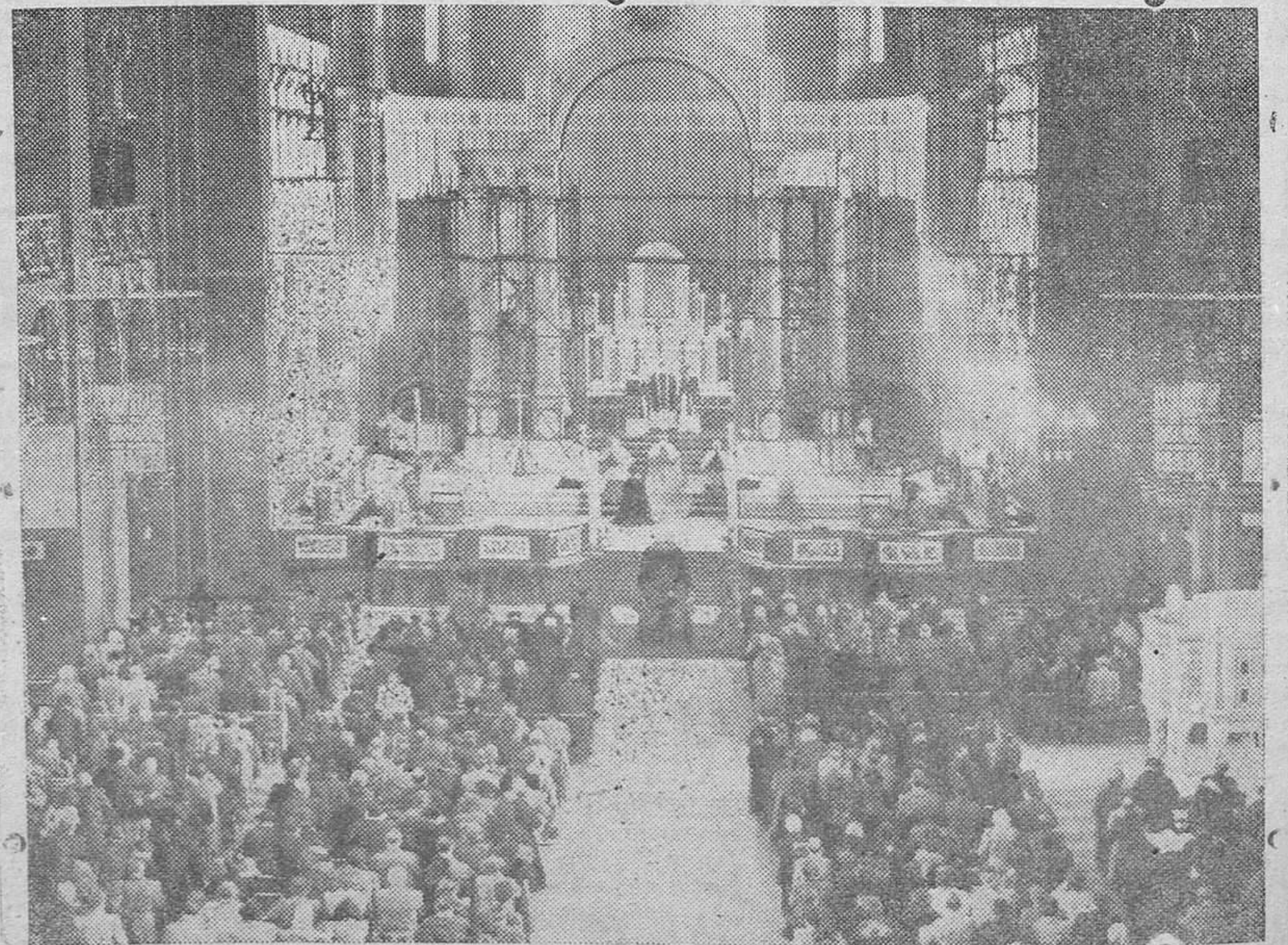
Por las almas de las personas muertas en los campos de concentración alemanes, se celebró un oficio religioso en Londres en la célebre catedral de Wetminster, al que asistió una gran muchedumbre.