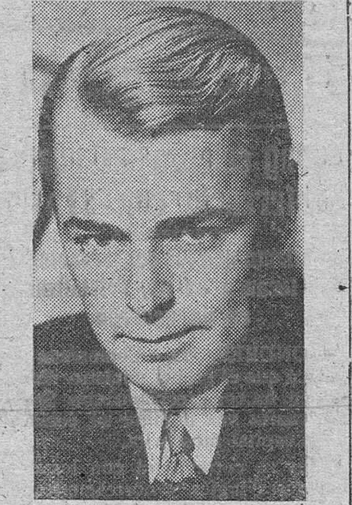
Una reciente fotografía de Bing Crosby, el protagonista de la nueva película de la Paramount «Going my way».

«Going my way», la nueva película de la Paramount, que lleva por título español «Siguiendo mi camino» y que ha alcanzado un «récord» de espectadores en todas partes donde se ha proyectado, es una historia de la fe y del triunfo de la bondad humana. Es de una gran oportunidad en estos momentos, pues que acentúa la importancia de la buena voluntad entre los hombres.