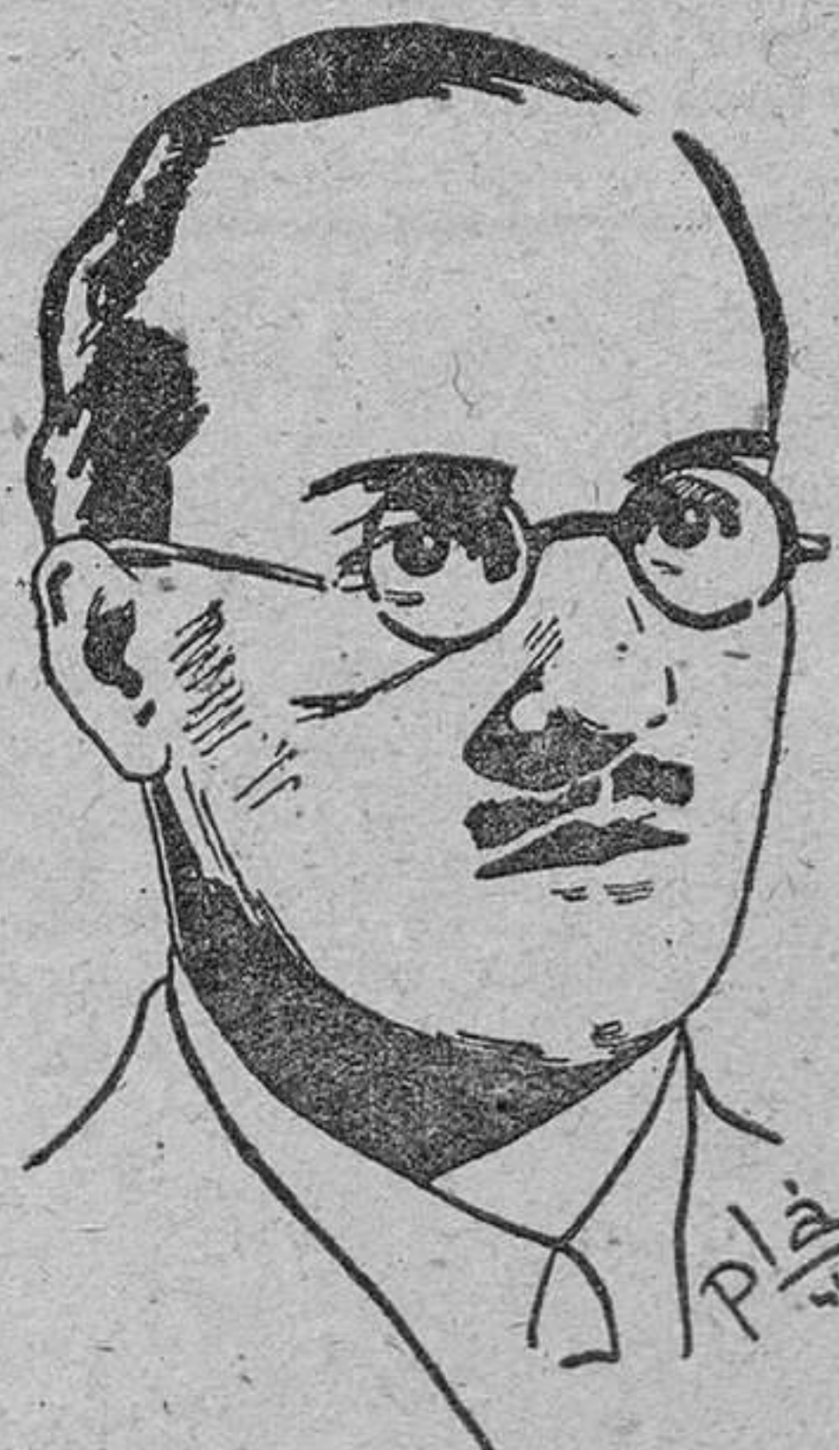
Excelentísimo señor don José Ibáñez Martín, ministro de Educación Nacional

LONDRES, 12.—El mariscal Montgomery ha llegado a Berlín, según anuncia la agencia «Exchange Telegraph».—Efe.