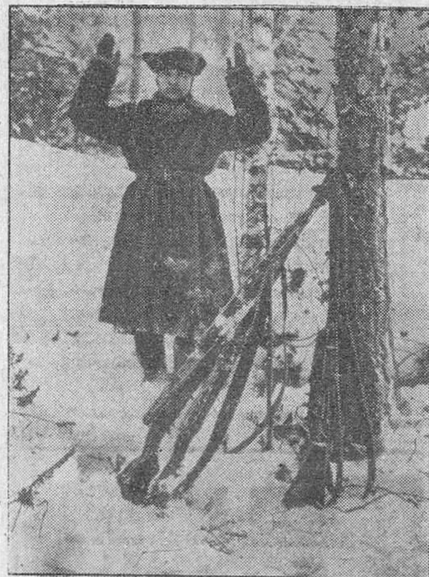
Los soldados soviéticos que defendían una posición conquistada por los alemanes se van entregando poco a poco

Berlín, 5.—Cual anuncia el comunicado militar, manifiestan los círculos berlineses que la jornada de ayer fué tranquila en el frente de Kerch y Sebastopol. En la región de Donez, por el contrario, hubieron de rechazarse violentos ataques de los bolcheviques con las consiguientes pérdidas de éstos.