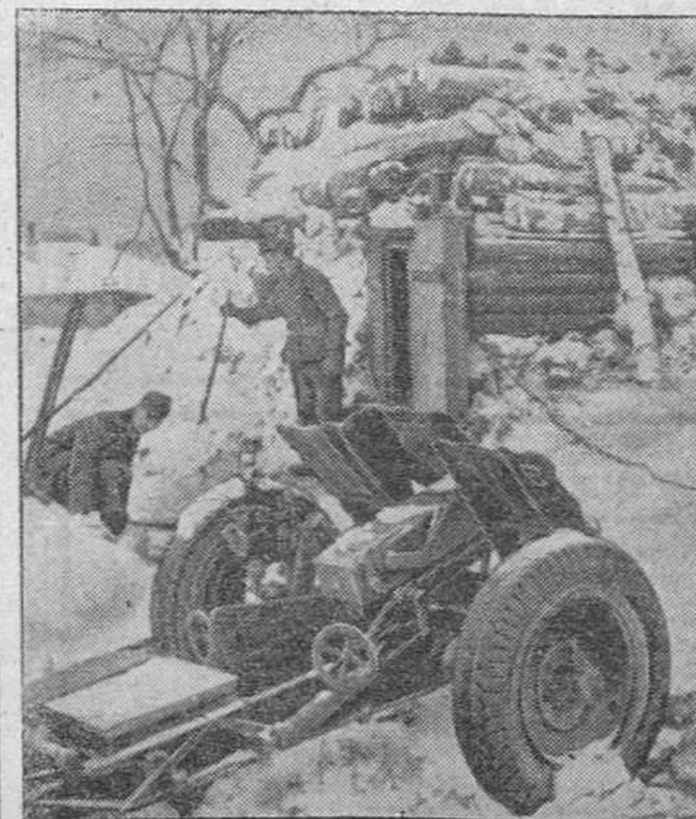
Antitanque alemán situado cerca de la primera línea

En el sector central, la aviación de reconocimiento alemana pudo comprobar la llegada por ferrocarril de refuerzos bolcheviques, tanto de hombres como de material. Inmediatamente emprendieron el vuelo los aviones de combate con la misión de atacar los trenes, que se sucedían a cortos intervalos. De resultados de estos ataques fueron cortadas las vías férreas y se obtuvieron buenos blancos en varias estaciones, varios impactos directos en los trenes e infligieron considerables pérdidas a los bolcheviques.—Efe.