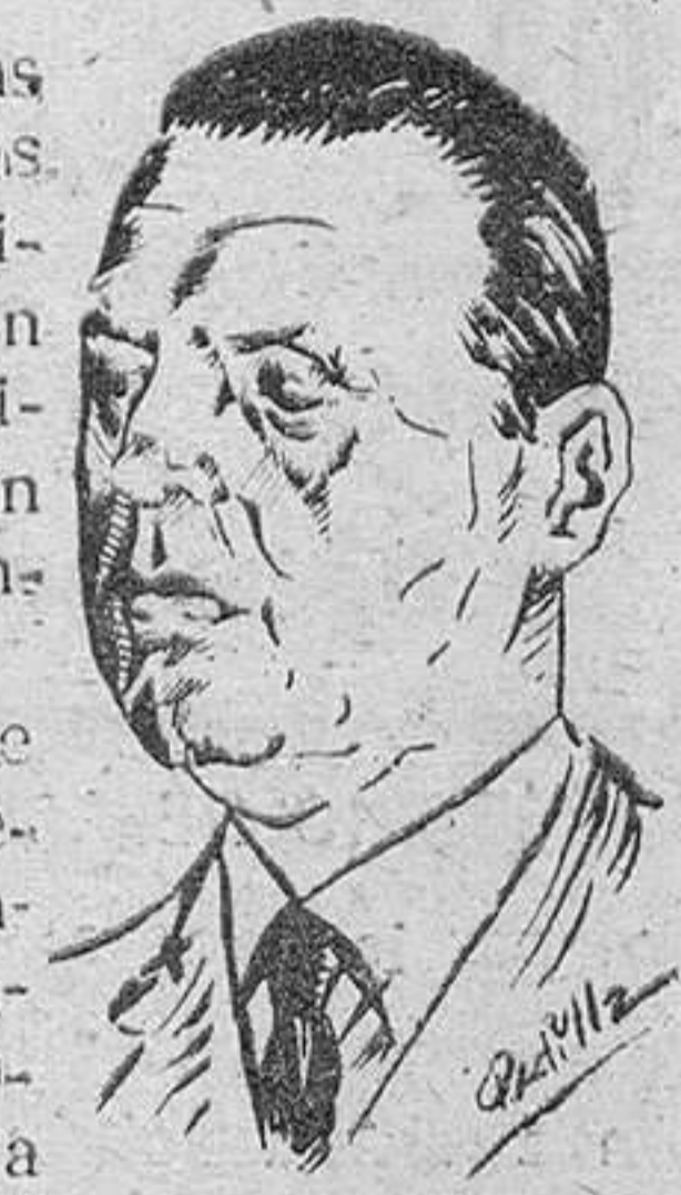
(Pasa a la página segunda)

Los dos candidatos radicales, a su vez, recogerán el voto, no sólo de los radicales, sus correligionarios, sino de los afiliados a los demás partidos antiperonistas.