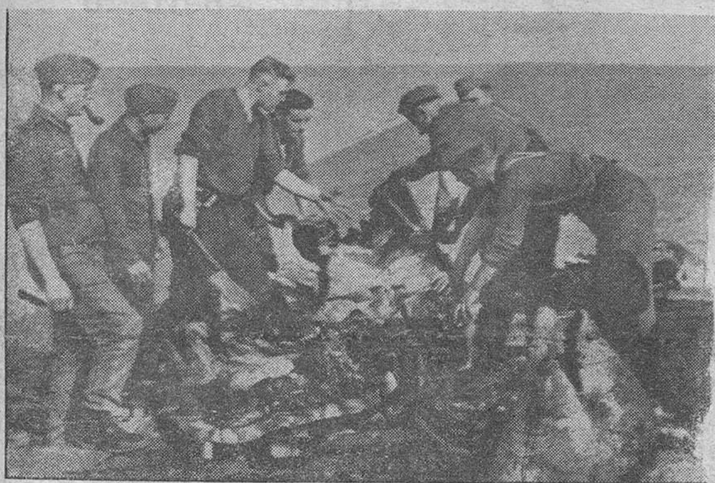
Las guarniciones de la defensa europea simultanean la vigilancia con la pesca. Un grupo alemán descuartiza un gran pez que quedó encerrado en las redes tendidas junto a las fortificaciones atlánticas