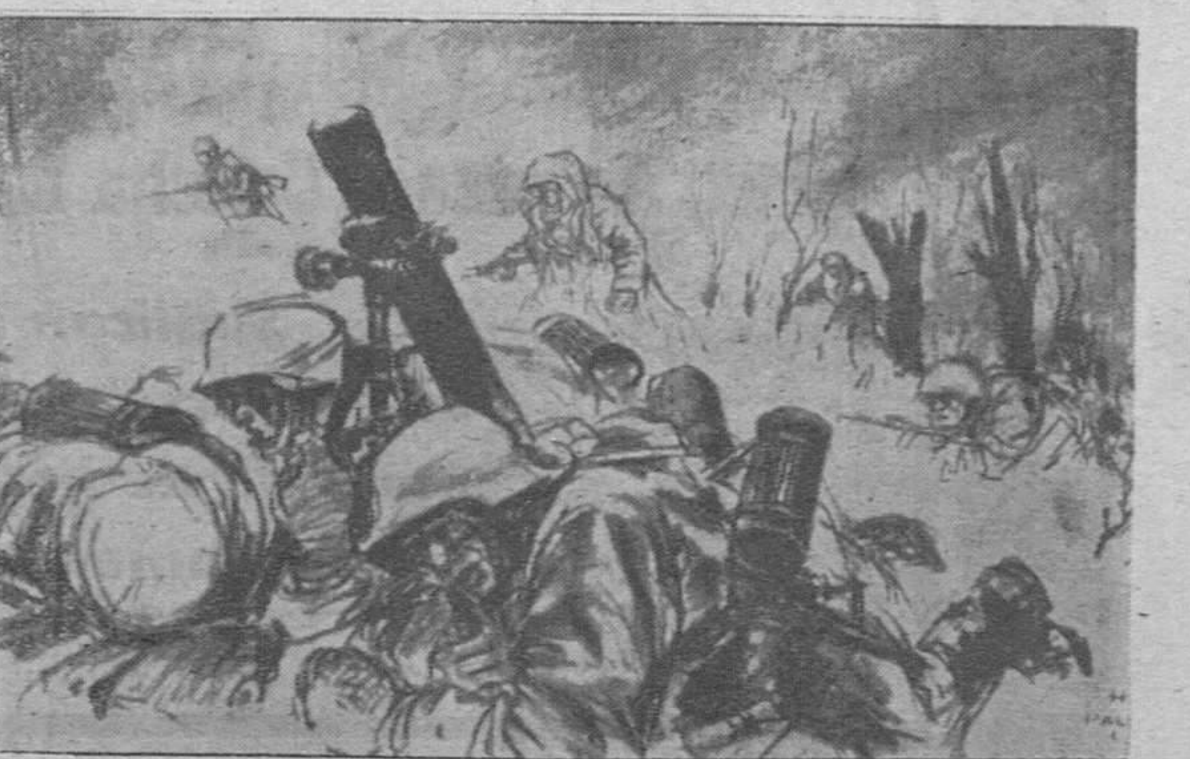
Granaderos alemanes se prestan a la defensa en el frente soviético. Dibujo de un artista soldado que en el fragor de la lucha aun tuvo tiempo para tomar estos apuntes