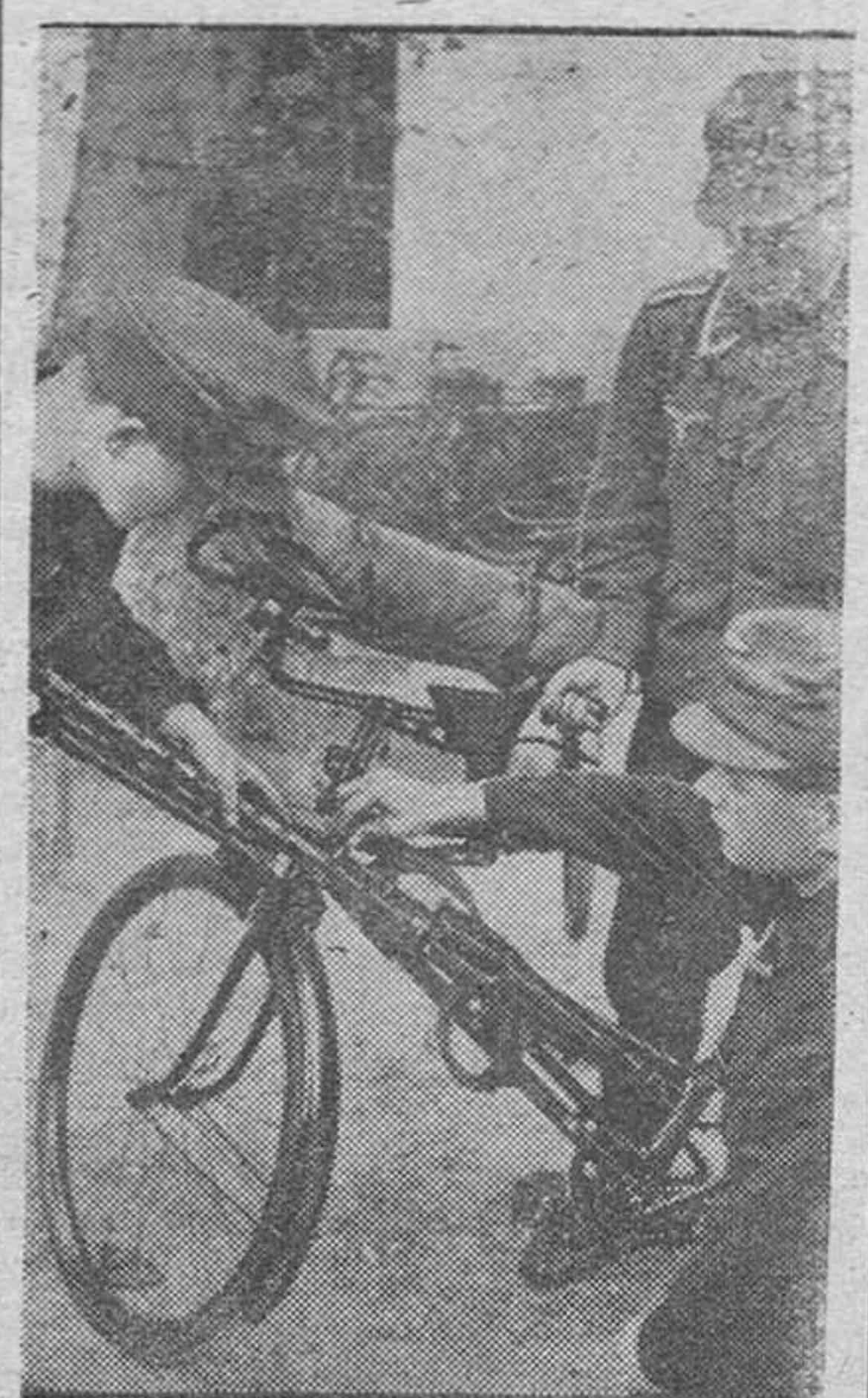
Enlace alemán al cumplir un servicio monta su fusil ametrallador sobre la frágil bicicleta para defenderse en caso de ataque durante el mismo