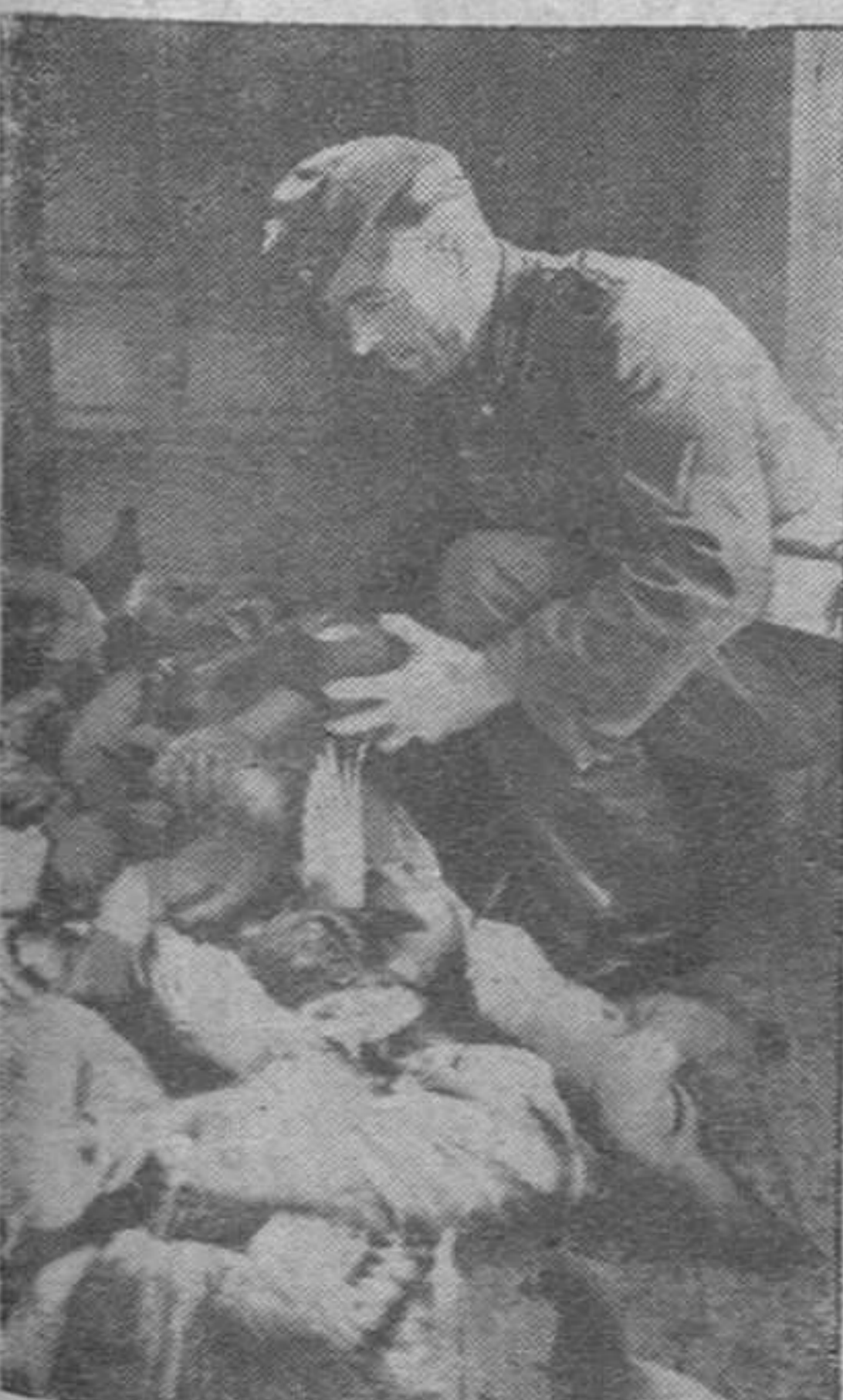
Soldado germano encargado del cuidado de los habitantes de un palomar se ve asaltado por los volátiles al echarles el alimento