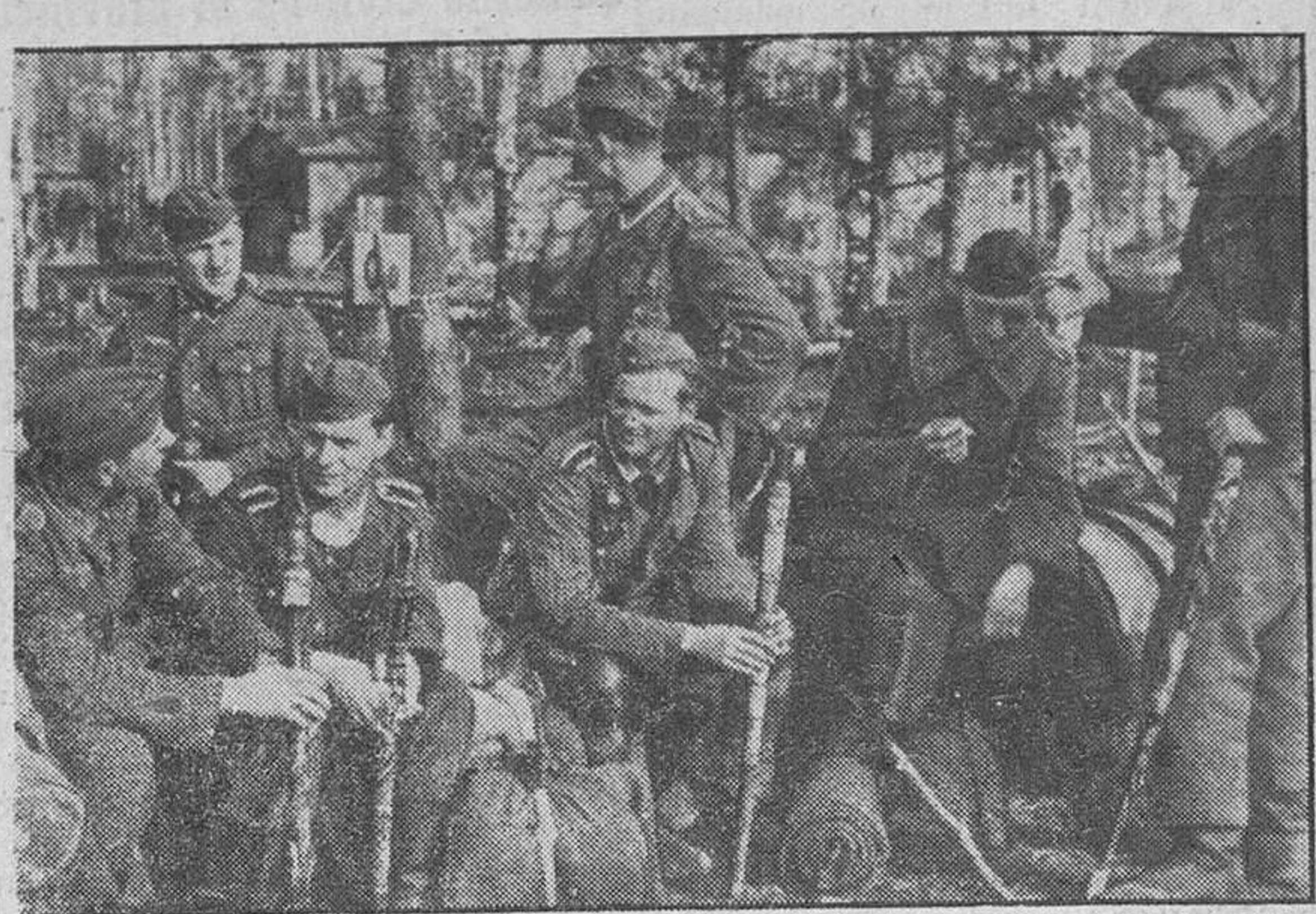
Soldados alemanes luchadores en el Este, que llevan como distintivo de la agrupación un bastón formado por ramas labradas a punta de cuchillo