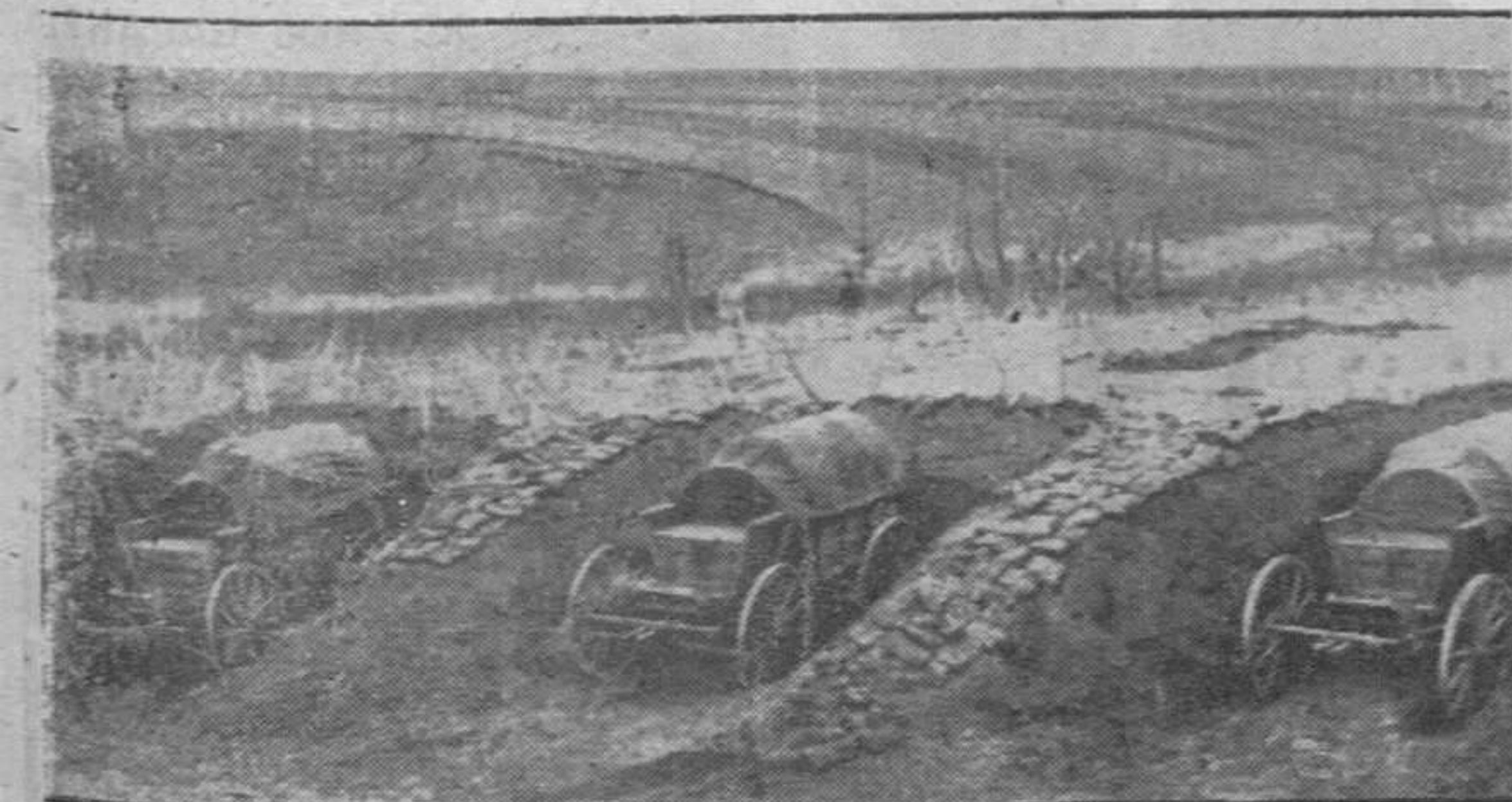
Carros de la intendencia alemana de tracción animal resguardados, en nidos cavados en tierra, de los ataques aéreos soviéticos