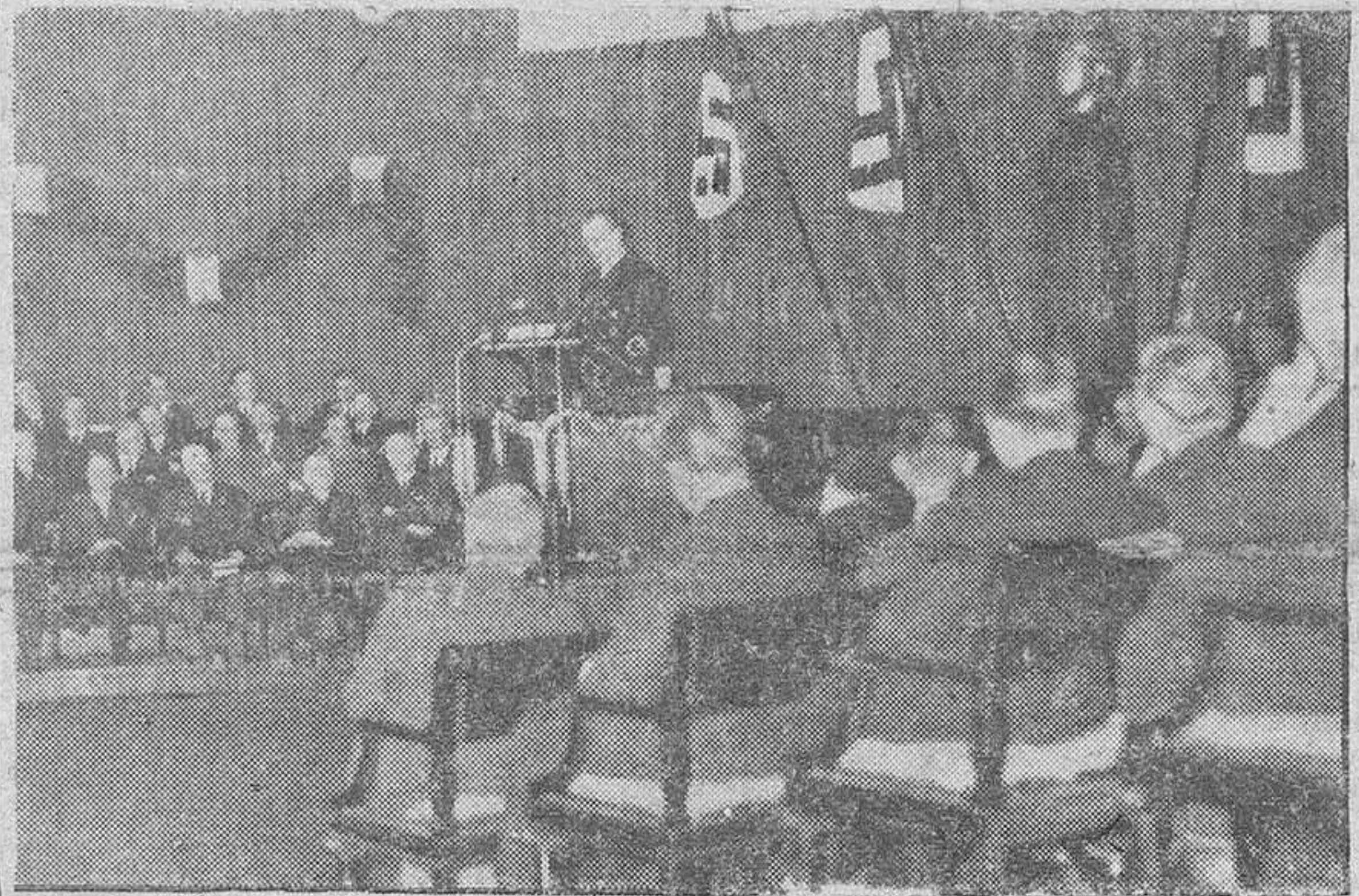
Recientemente ha sido nombrado por el Führer Presidente de la Academia Alemana el Dr. Seyss-Inquart, a quien vemos en nuestra fotografía pronunciando un discurso al tomar posesión de su nuevo cargo.