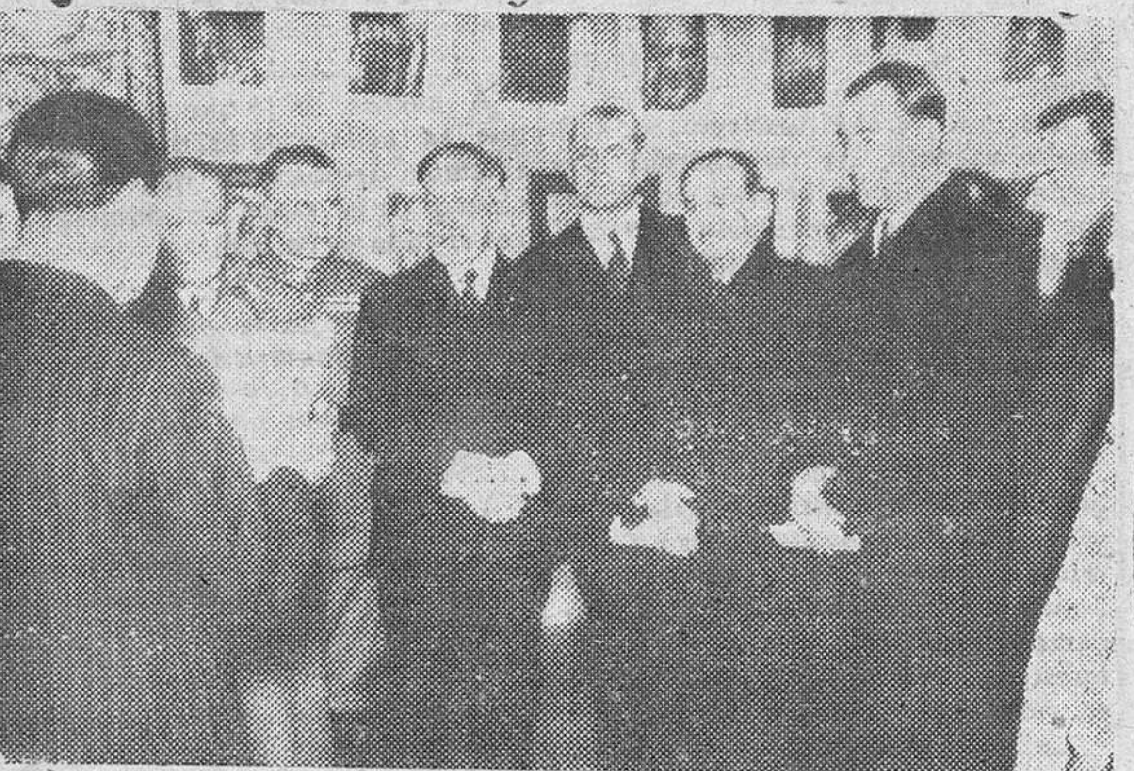
Los ministros secretario General del Movimiento y de Agricultura, camaradas José Luis de Arrese y Primo de Rivera, asisten a la inauguración de la Exposición de la Semana Santa malagueña que ha sido abierta en el Círculo de Bellas Artes de Madrid.