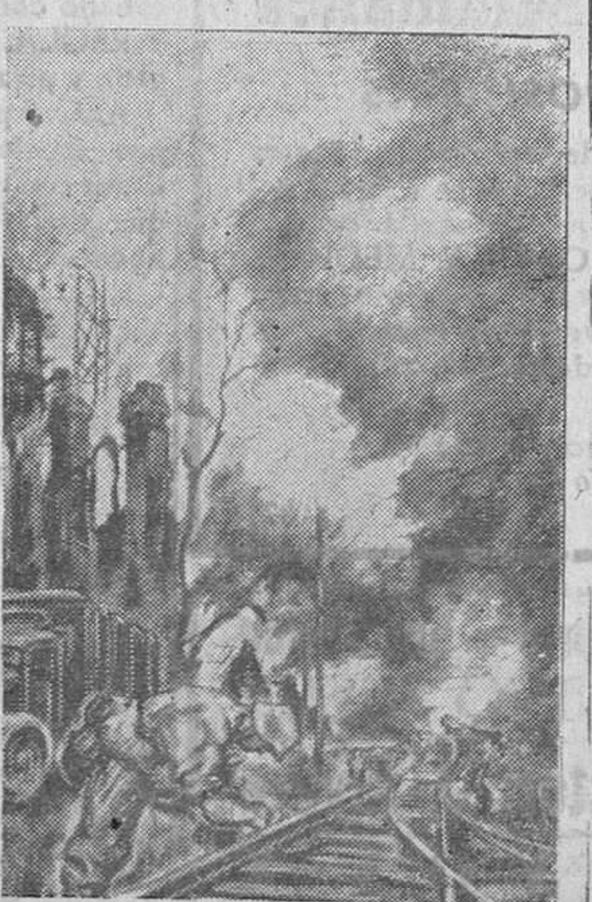
Dibujo de un corresponsal de guerra alemán que muestra cómo es destruido un importante nudo de comunicaciones ferroviarias antes de abandonar una posición.