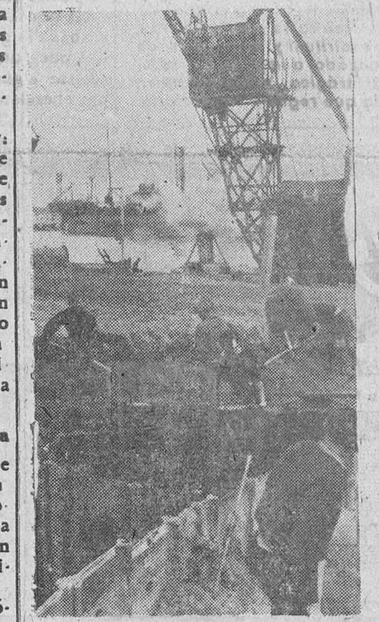
Formaciones de la organización Todt siguen construyendo bases para submarinos en la costa del Atlántico.