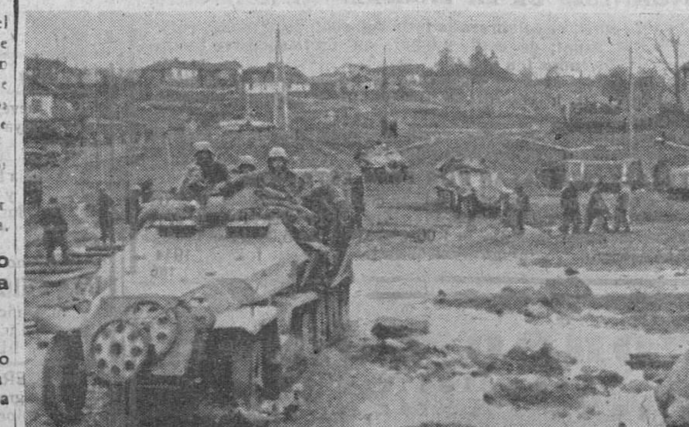
A pesar de las dificultades puestas por los bolcheviques, el contraataque de los alemanes progresa en diferentes sectores.