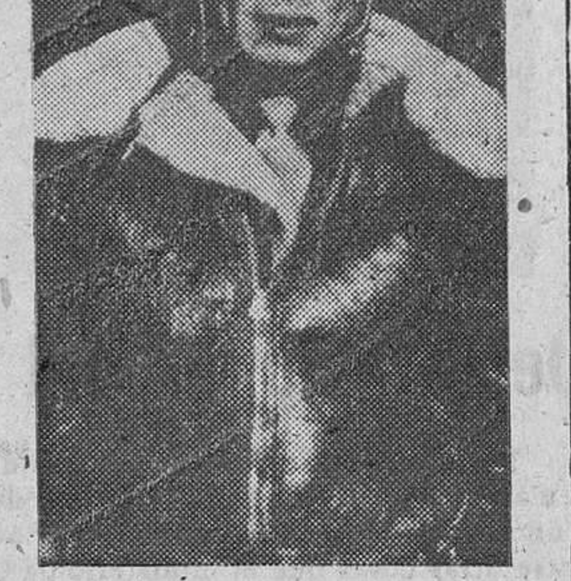
El Sargento Ben Kuroki, americano de origen chino, que ha realizado 30 misiones en el Teatro de Guerra Europeo.