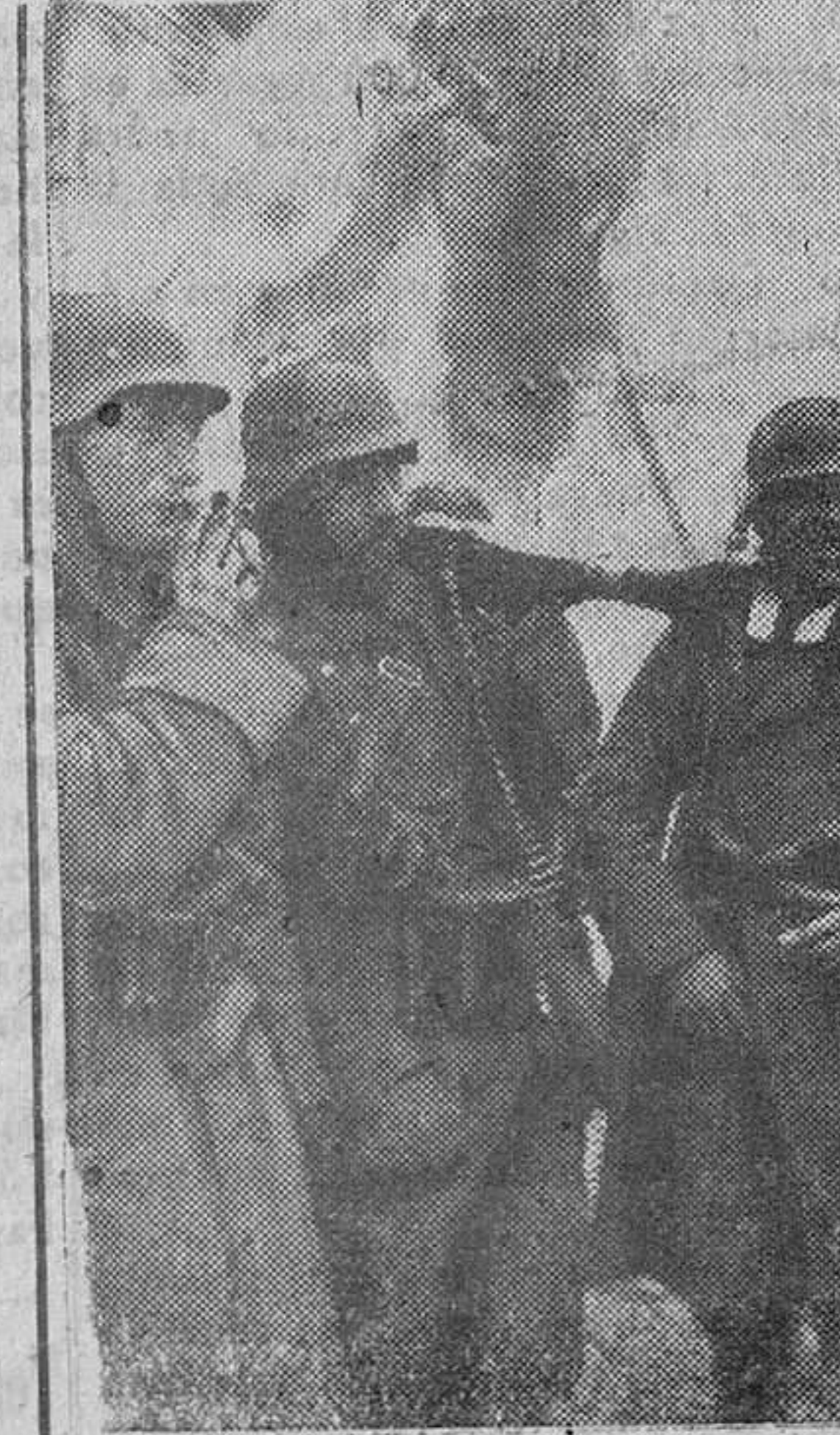
Un momento de calma en la pelea es aprovechado por estos soldados alemanes para fumar un cigarrillo