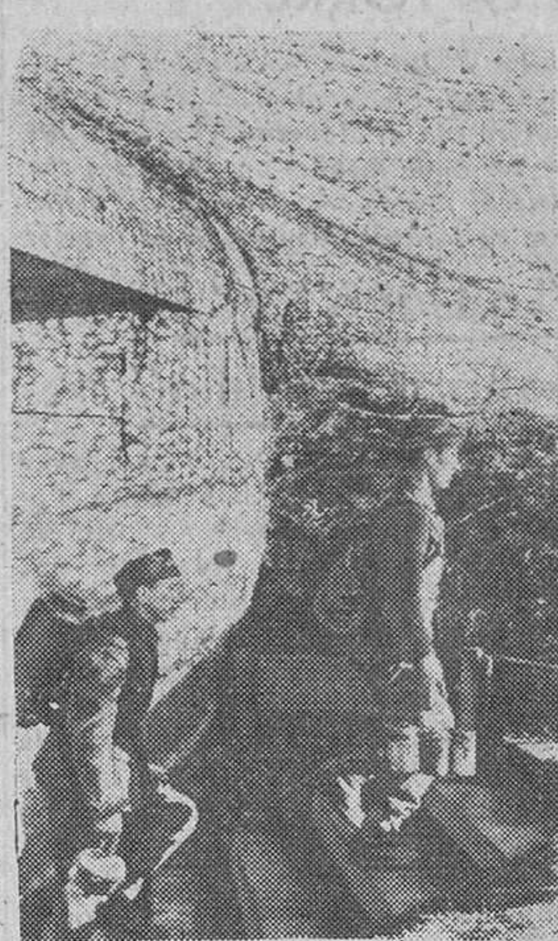
Soldados de la Intendencia sirven el rancho a las secciones que vigilan en un poderoso fortín de la línea defensiva alemana en el Atlántico