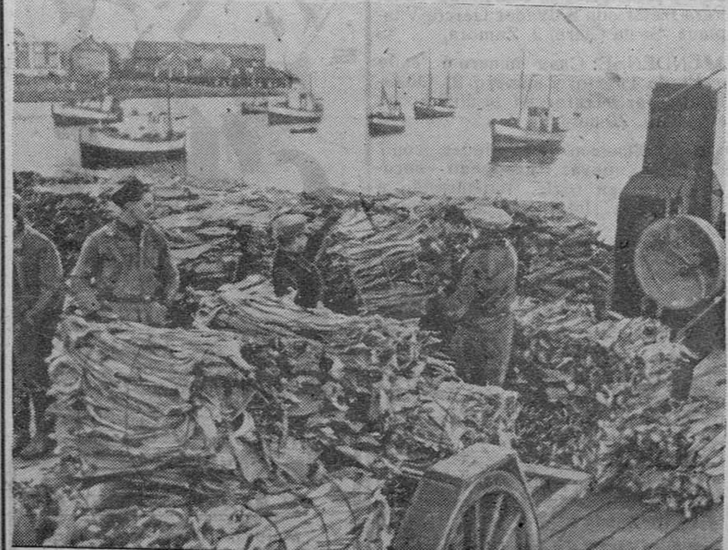
Bacalao preparado en un puerto del Norte de Noruega para ser transportados a Alemania