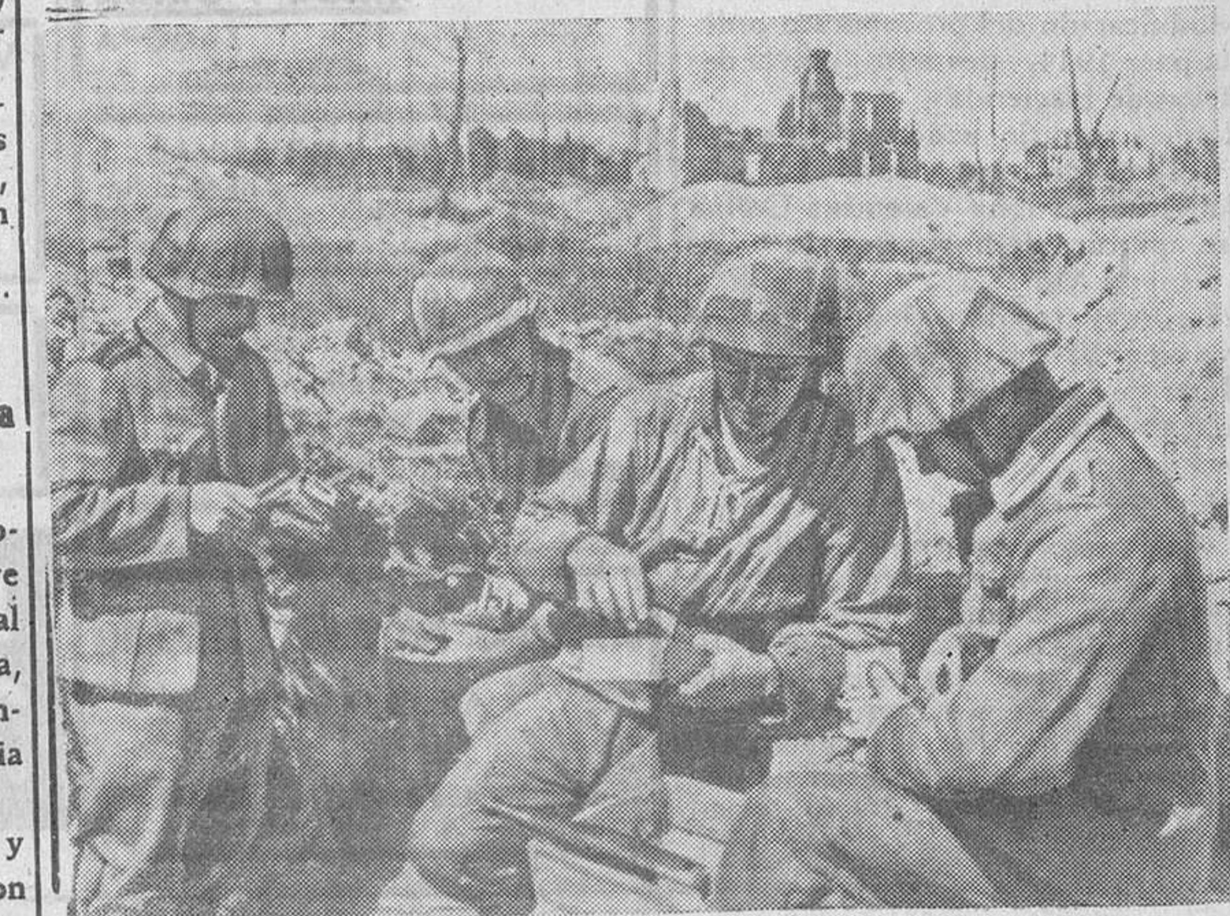
A una trinchera del frente del Este acaba de llegar el correo. Entre él vienen algunos paquetes que son recibidos con gran alegría por los soldados alemanes.