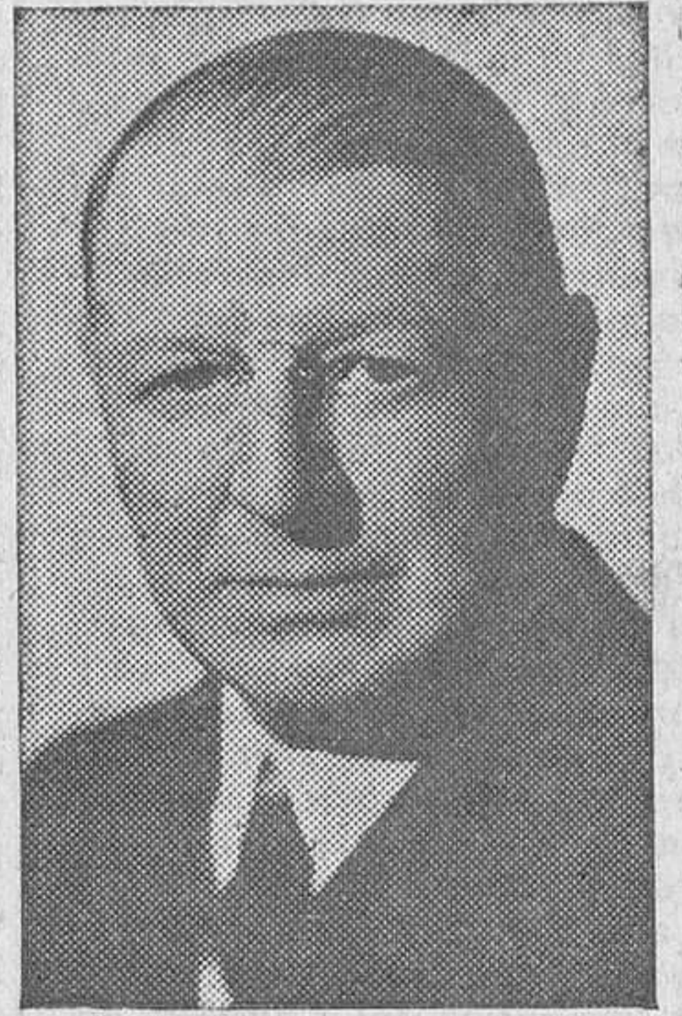
Frank Knox secretario de Marina de los EE. UU.