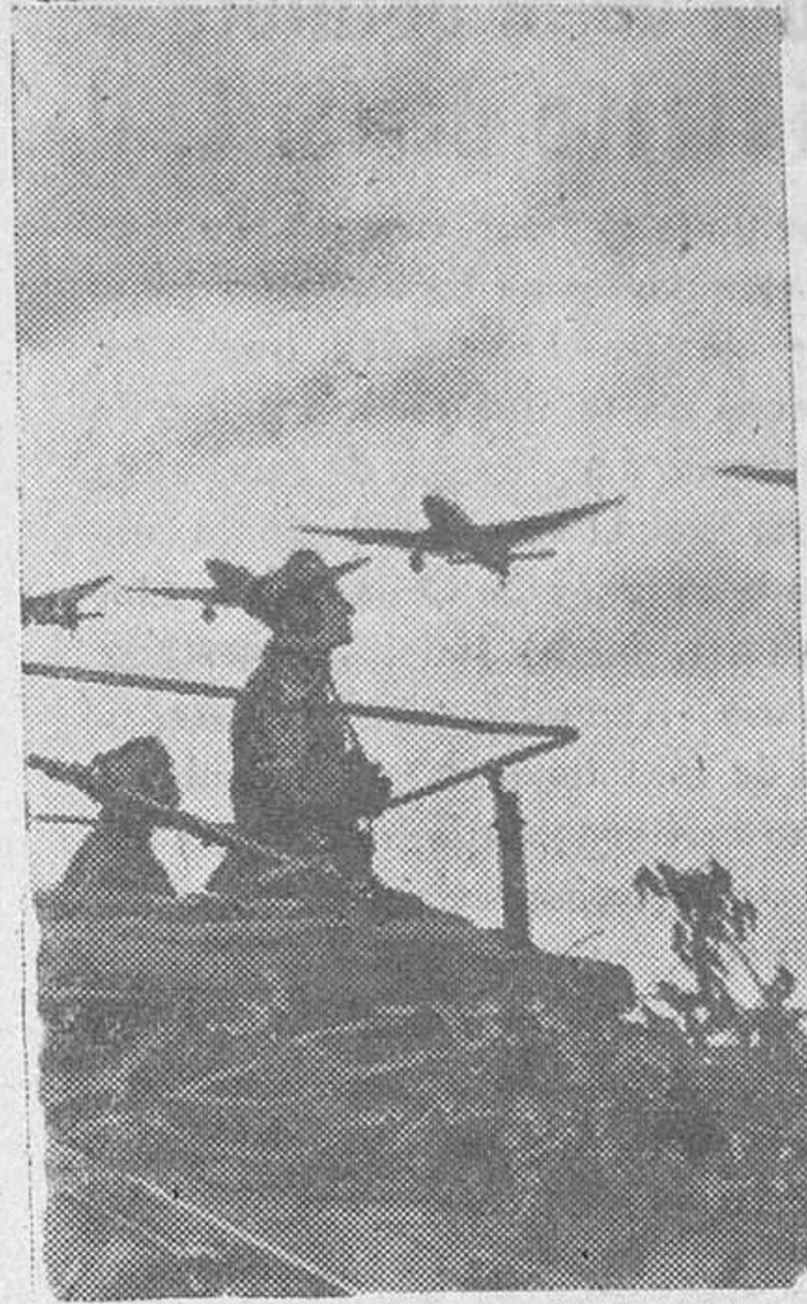
La Luftwaffe contrarresta la acción antitanque de los bolcheviques