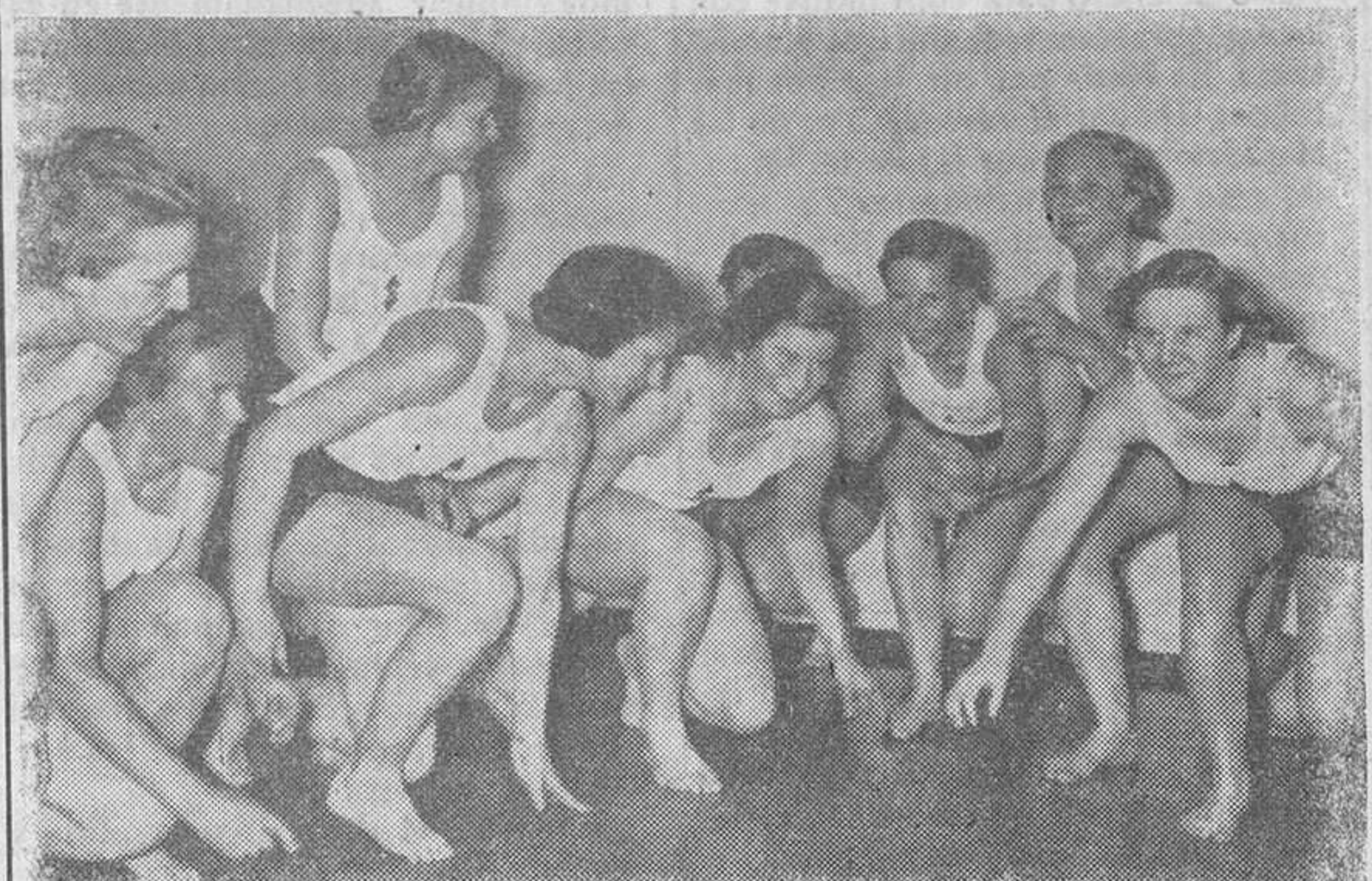
Muchachas del Partido alemán, realizando sus ejercicios gimnásticos matinales