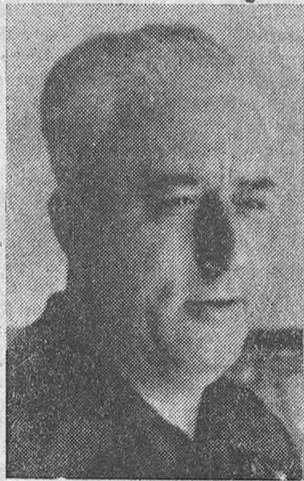
Teniente general Yagüe