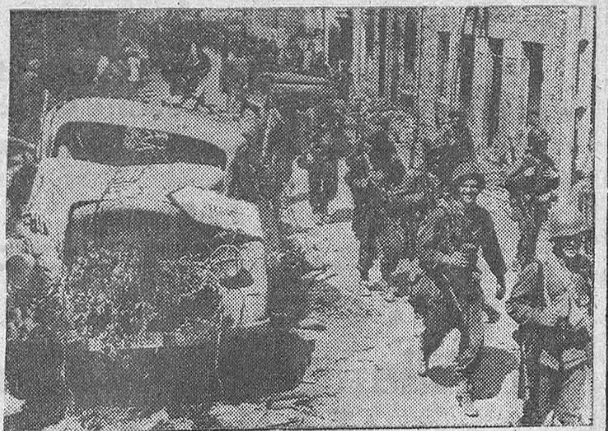
Tropas aliadas de infantería cruzan un pueblo en la región de Amberes, camino de las posiciones avanzadas

BRUSELAS, 24.—Noticias oficiales.—(Termina en la página 6.)