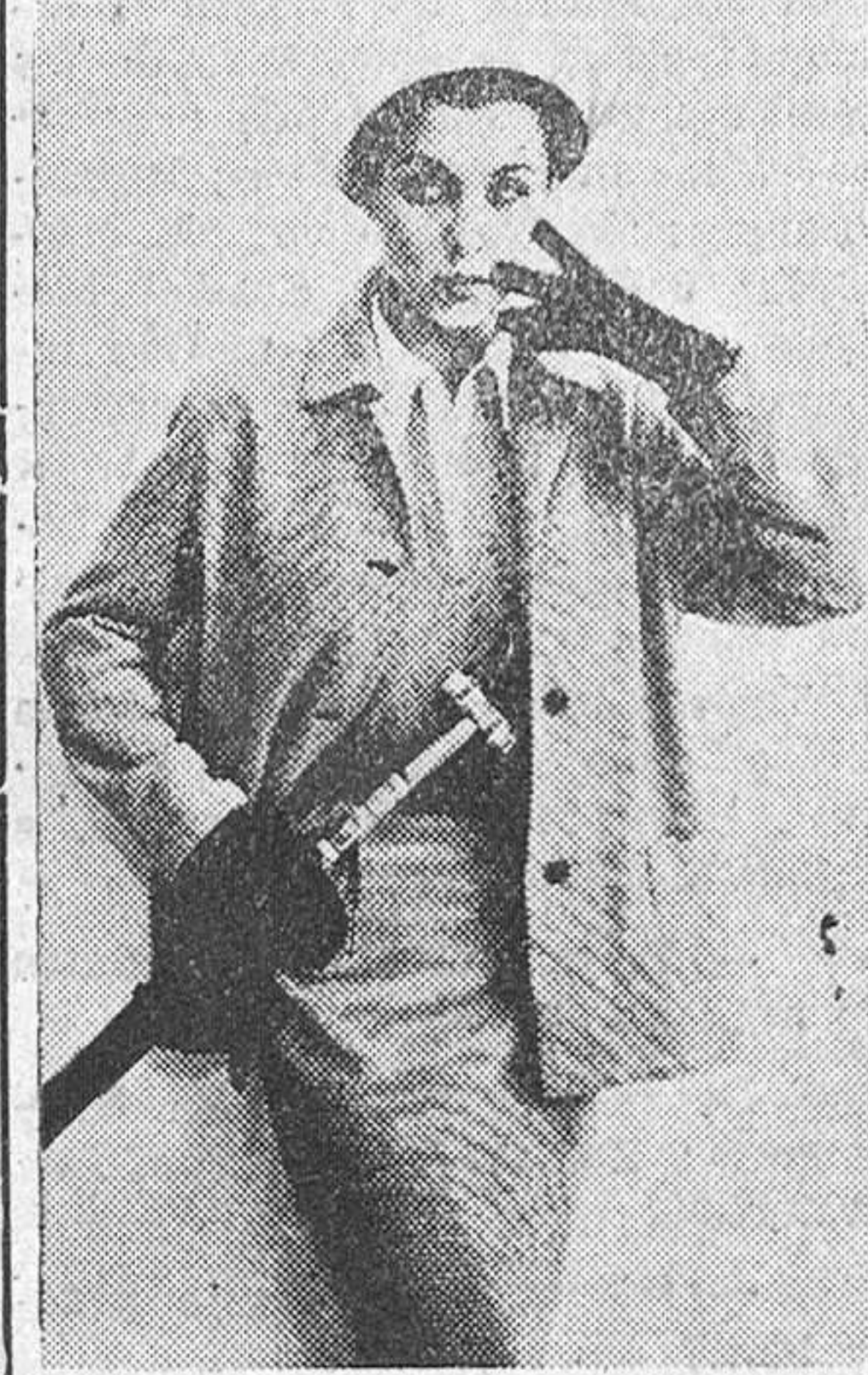
Dorville, de Londres, presenta esta dos piezas de lana a cuadros blancos y negros, ideal para la mujer que trabaja

ciudad, y a cuadros, preferentemente, para el campo y se llevan con una falda de color liso o neutro, armonizando, en el primer caso, con las tonalidades de la chaqueta. También puede dispñarse de una falda plisada y otra recta, para combinarlas con una misma chaqueta, variando el jersey o la blusa. Los guantes, zapatos, bolso y sombrero han de armonizar con el conjunto.