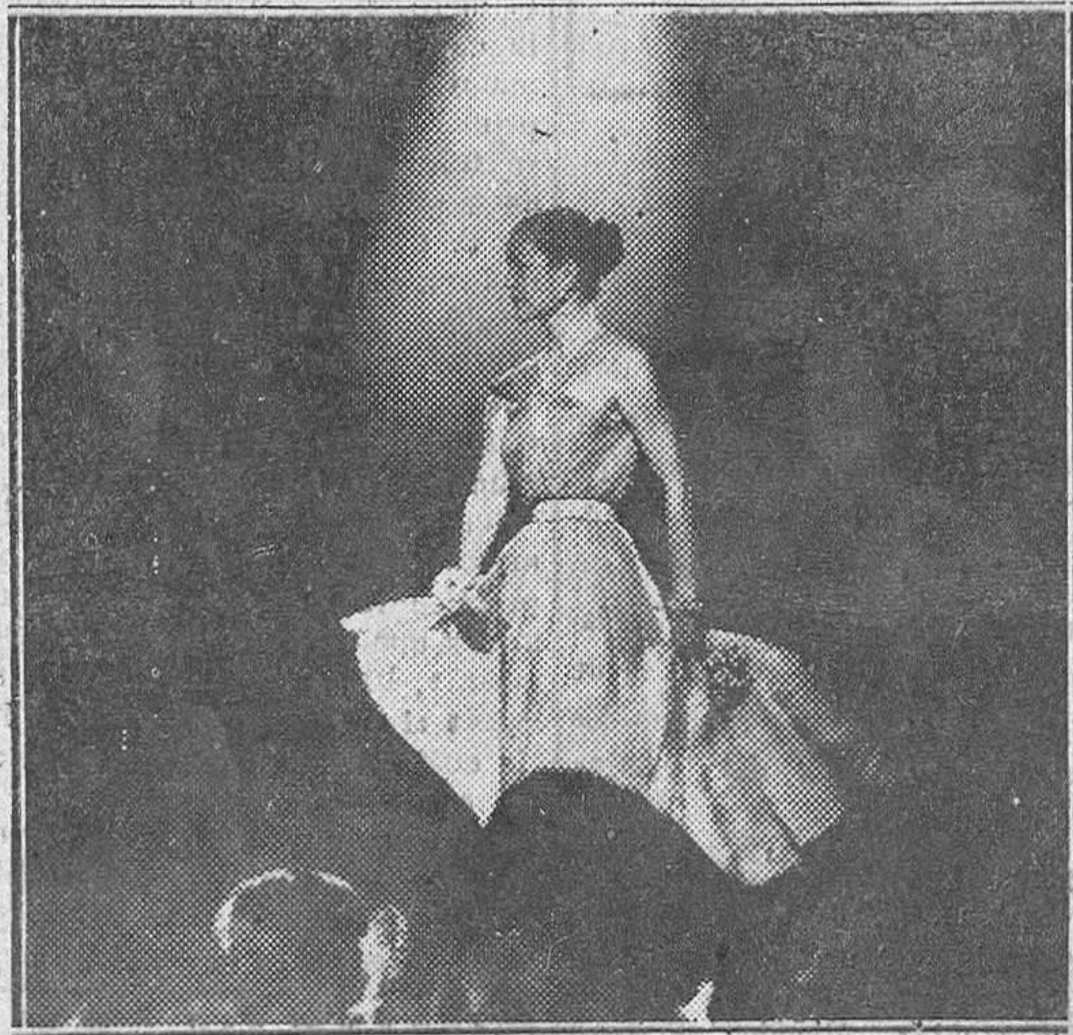
En la exposición benéfica celebrada por la Asociación Internacional de la Seda, en Nueva York, entre muchas creaciones, presentaron este modelo lindísimo, al cual bien podría dársele el nombre de "Mariposa", por su vaporoso encanto.