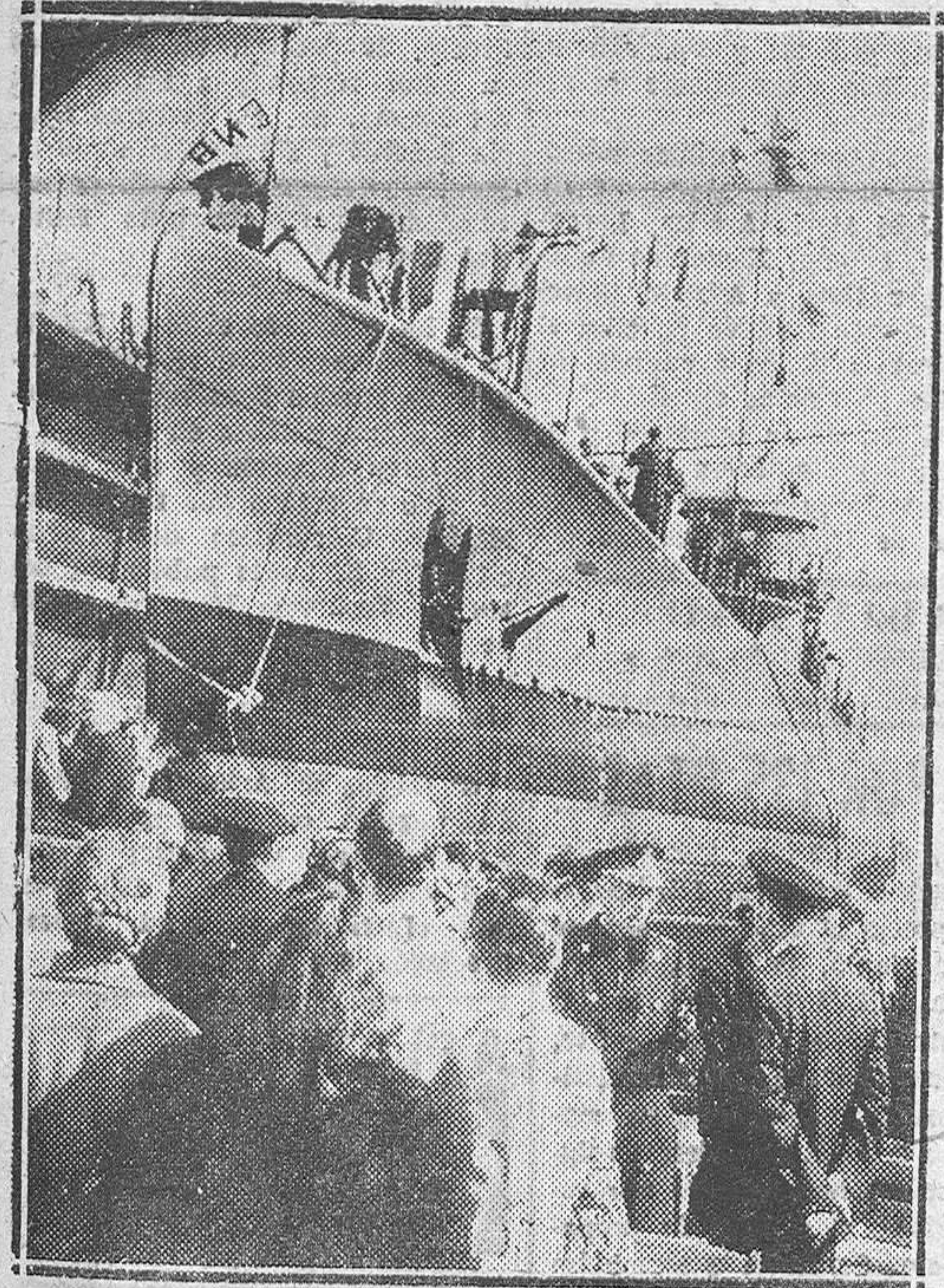
CARTAGENA.—Las autoridades y otras personalidades durante el acto de la botadura del submarino D-3, construido en los astilleros de la empresa nacional "Bazán"

PARIS, 3.—Después de su entrevista con el presidente de la República Pinay declaró que había aceptado el encargo de intentar la formación de Gobierno pero contra su voluntad. «Traté de disuadirle —dijo— pero en vista de la insistencia del presidente tuve que acceder». Agregó que lamentaba acceder a probar qué es lo que se puede hacer.—Efe.