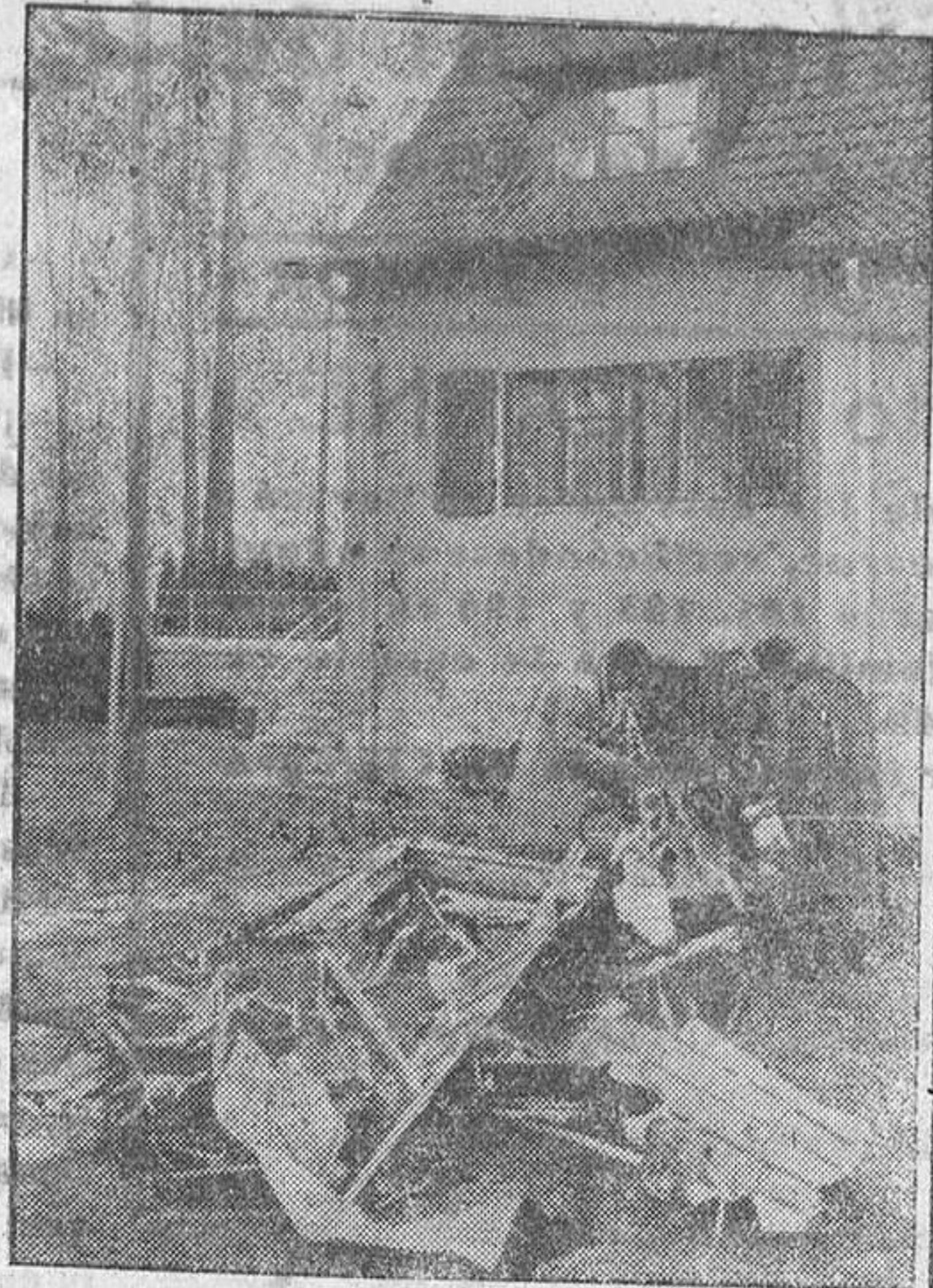
Restos de un aparato de bombardeo inglés derribado en los arrabales de Berlín

Continúan animosos su marcha las 42 camaradas de la Organización Juvenil que componen la representación de la Falange zamorana, que el día 19 rendirá ante la tumba de José Antonio, en el monasterio escorialense, su más sincero y emocionado homenaje, haciendo entrega del enfervorizado mensaje de que son portadores. Desde su salida, verificada el domingo pasado, a las ocho de la mañana, han pasado estos camaradas los pueblos de Coreses, Fresno y Toro, donde pasaron la primera noche. Al día siguiente llegaron a Torrellas, donde descansaron todo el día siguiente. El miércoles salieron de Torrellas y llegaron a Medina del Campo, siendo las últimas noticias recibidas el viernes, las de su llegada a Arévalo, donde también descansaron. En todas las informaciones dadas, que el jefe de expedición via desde los puntos finales de la marcha, hace constar siempre el entusiasmo con que el vecindario de todos los pueblos de su itinerario, presidido por las jerarquías locales, les recibe siempre, también las cariñosas muestras de simpatía que se les dispensa en las ciudades donde han hecho parada, así, por ejemplo, en Medina del Campo, todos ellos fueron invitados a una sesión cinematográfica. En resumen, nuestros camaradas continúan sin novedad y animados del más alto espíritu su marcha hacia El Escorial, donde llegarán con todo éxito el día siguiente y señalado. Nuestros camaradas verificarán su regreso en camiones. Tel. de IMPERIO 1570