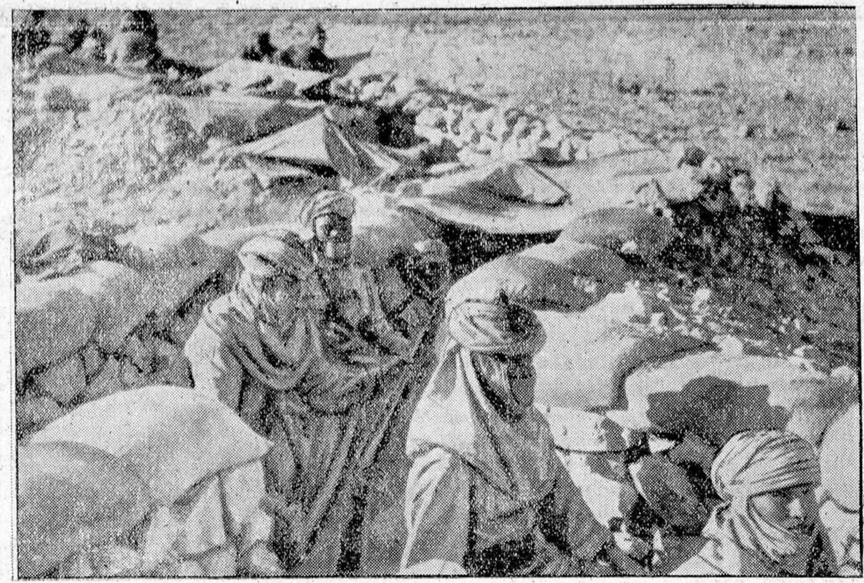
Soldados del Ejército colonial italiano en un sector del frente libio.

En el Egeo, entre los días 3 y 4 de febrero, los aviones adversarios lanzaron sobre alguno de nuestros aeró-