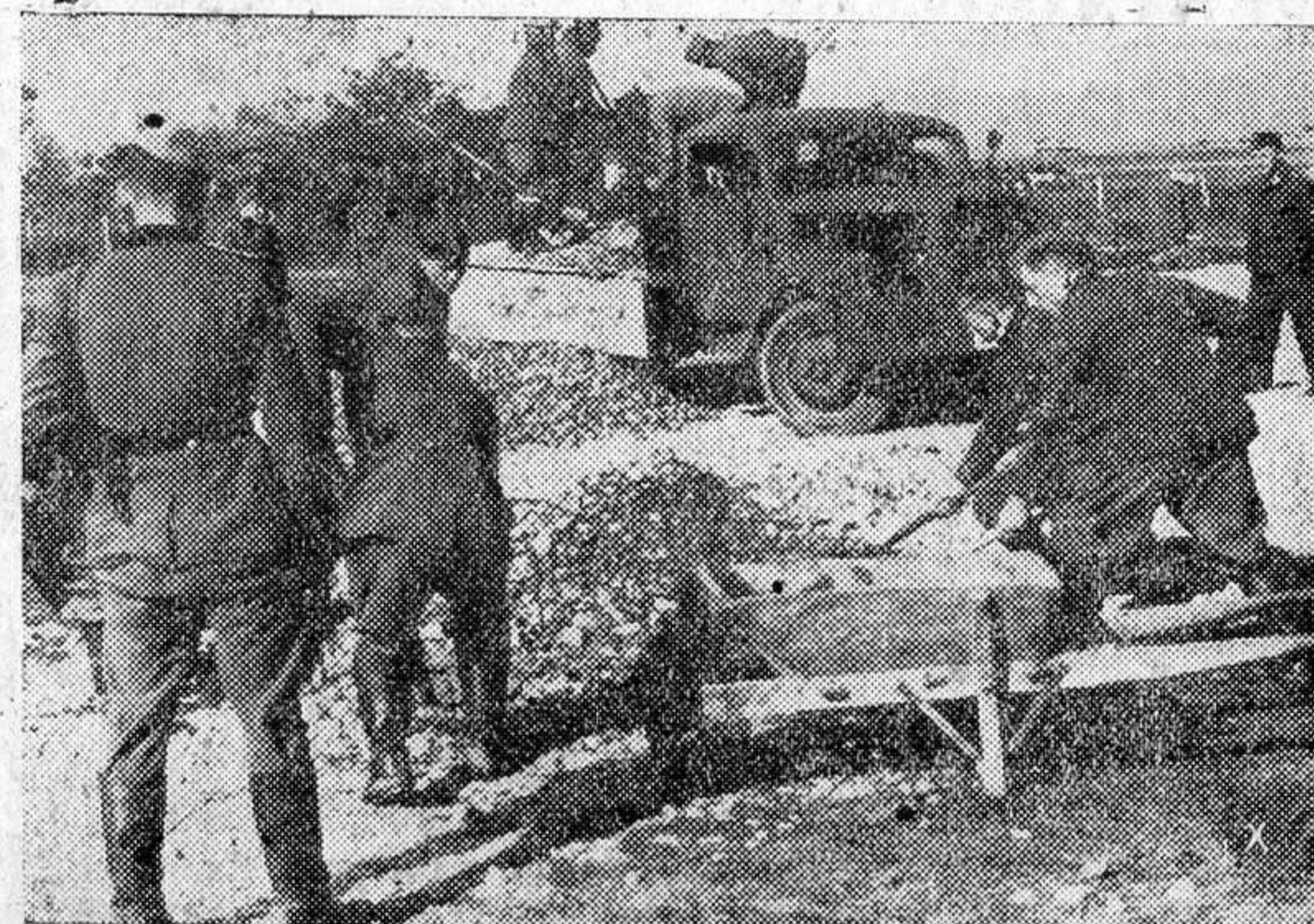
El Servicio de Trabajo alemán viene empleándose en múltiples trabajos, en los países ocupados. He aquí un destacamento trabajando en un nuevo aeródromo de campaña en la costa francesa.