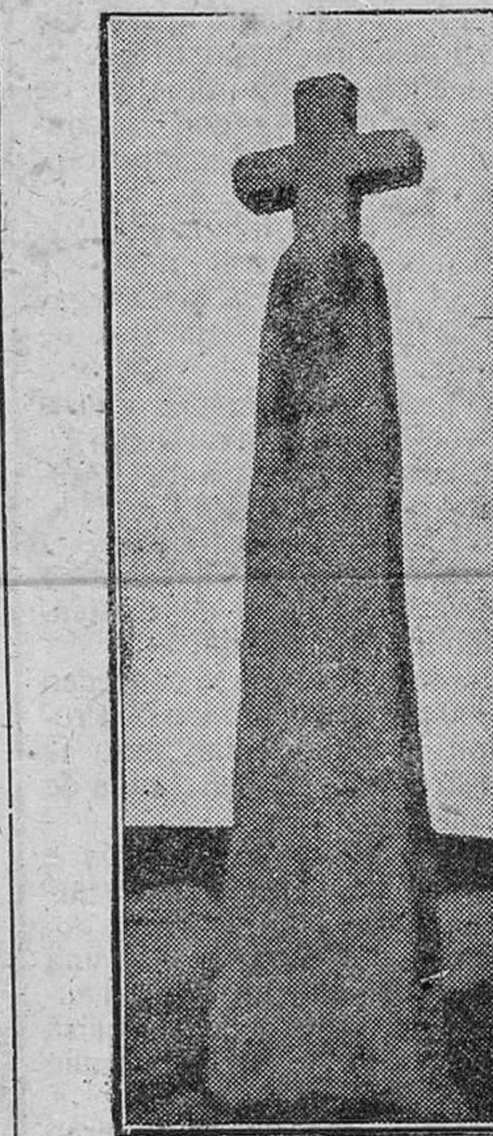
La Cruz del Rey Don Sancho, lugar donde en la mañana de ayer la procesión de la Virgen de la Concha entonó el responso a la memoria del Rey que puso cerco a la ciudad de Zamora