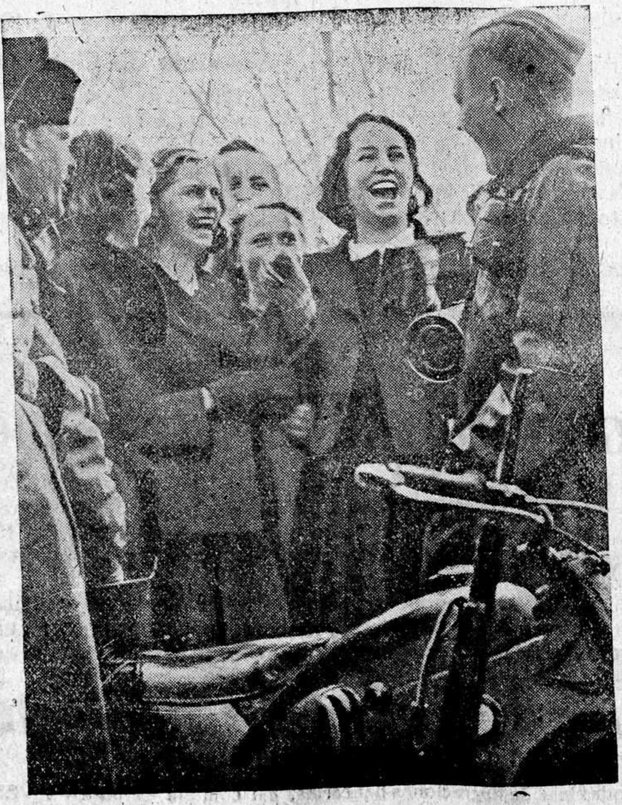
Instantánea que se ha repetido muchas veces tanto en Dinamarca como en Noruega. La juventud dispone de reortes propios para establecer un rápido contacto pacífico

Nueva York.—Henry Ford ha hecho unas declaraciones a la prensa en las que afirmó que estaba convencido de que la guerra europea no durará mucho tiempo porque los Estados Unidos no han entrado en ella. Refiriéndose al programa de rearme de su país, añadió: «En realidad esa quinta columna de que tanto se habla ahora no está formada sino por los financieros que hacen propaganda de las guerras. Se ejercen fuertes presiones para arrastrarnos al conflicto actual, y el programa de armamentos lleva en sí grandes gérmenes de peligro, pero tengo la seguridad de que América podrá conservar su paz».—Efe.