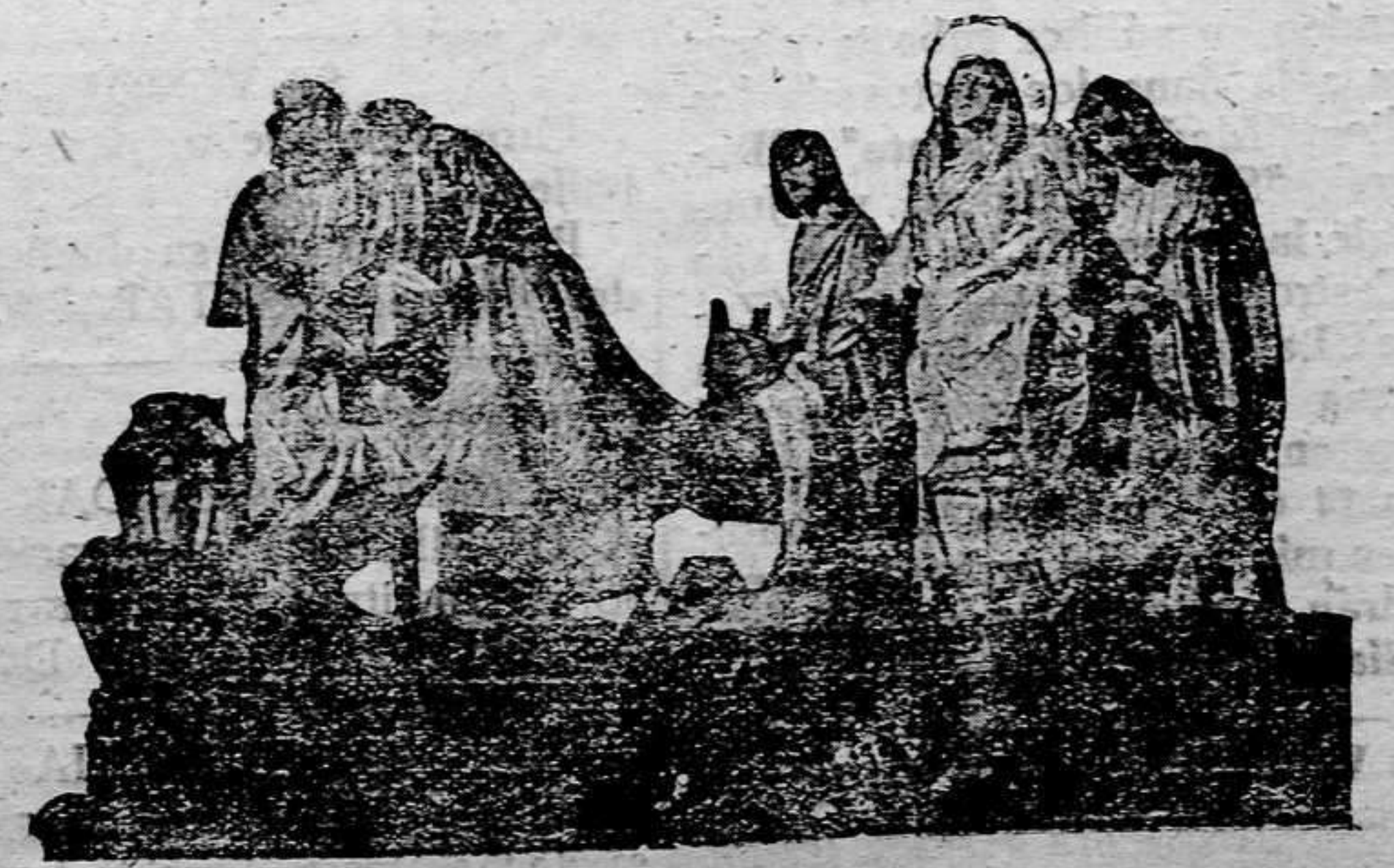
LA CONDUCCION AL SEPULCRO