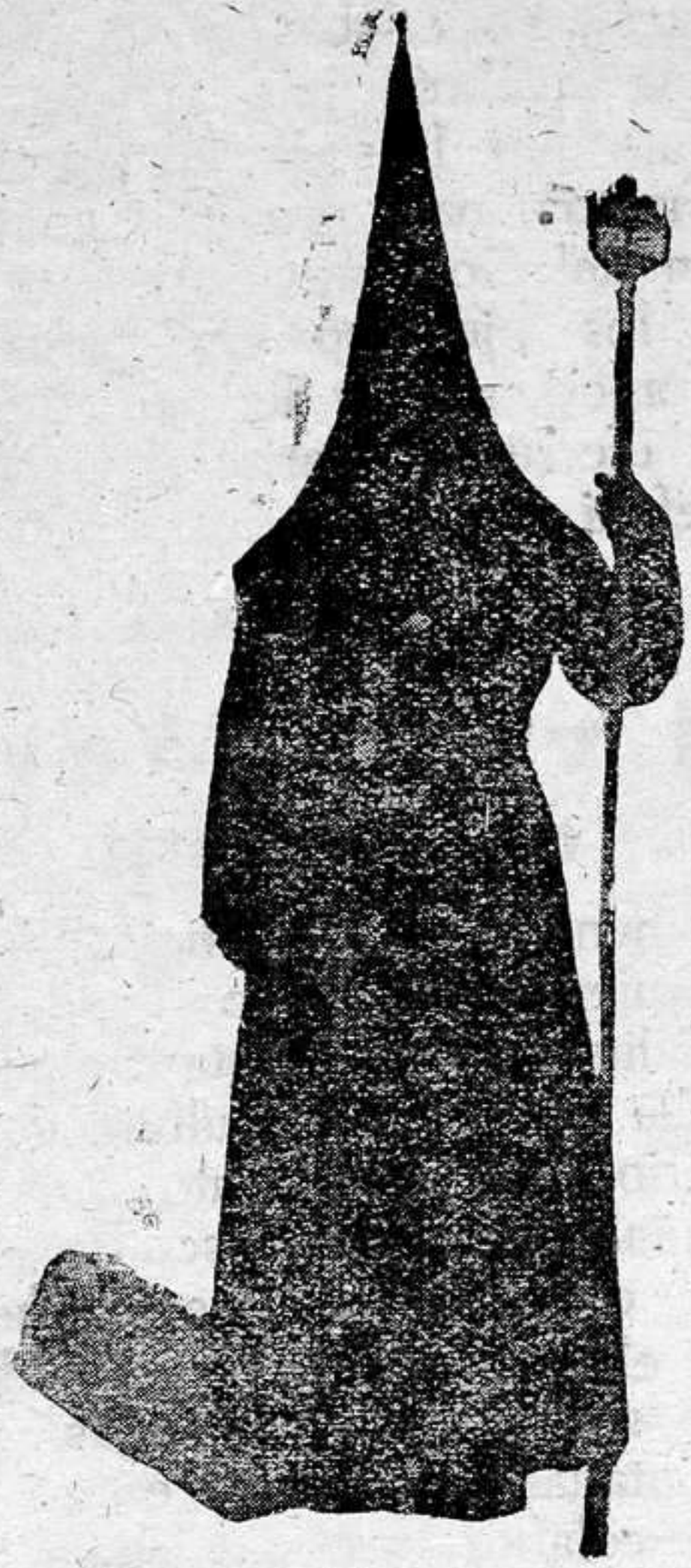
Cofrade del Santo Entierro

He aquí el día grande e inigualable de nuestra Semana Santa. Cuando apenas la gente se ha retirado a descansar para reponer sus fuerzas gastadas por el ajetreo del día anterior, no bien nacido el día de Viernes Santo, allá contra la una de