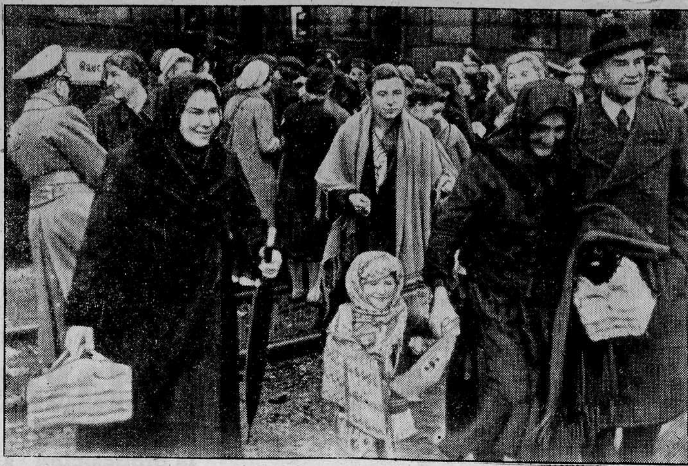
Los alemanes residentes en Besarabia serán reintegrados al Reich, en virtud del acuerdo concertado entre Alemania y Rusia. He aquí uno de los primeros transportes a su llegada a la Patria.