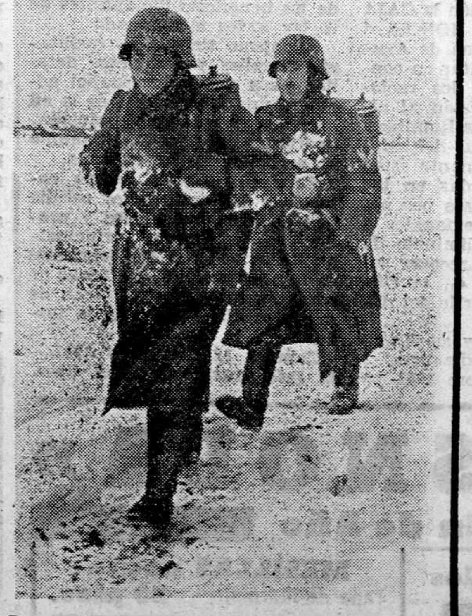
Los soldados alemanes encargados de llevar el rancho a las primeras líneas en una especie de termos que se adaptan a la espalda.

Tokio.—La situación militar ha sido expuesta por el presidente del Consejo, general Tojo, en un informe presentado al Parlamento. El primer ministro ha hecho un relato minucioso de las operaciones realizadas con tanto éxito por el ejército, la marina y la aviación niponas y sobre todo la actuación en Filipinas donde las tres armas han concentrado sus esfuerzos en la destrucción de las fuerzas aéreas enemigas. El éxito de estas operaciones ha sido tal, dice Tojo, que al tercer día de las actividades pudo realizarse un desembarco de tropas al Norte de la isla de Luzón. El segundo grupo de fuerzas avanzó hacia Manila y redujo en todos sus puntos la lucha de defensa del adversario. Refiriéndose al desembarco de tropas japonesas en Borneo, puso de relieve una vez más, la firme decisión del Gobierno y del pueblo de luchar hasta la victoria final.—Efe.