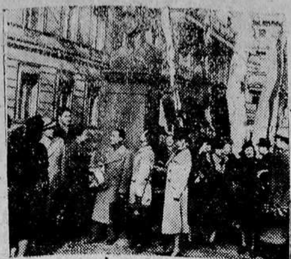
Grupo de alumnos, en su visita al Museo de Berlín.