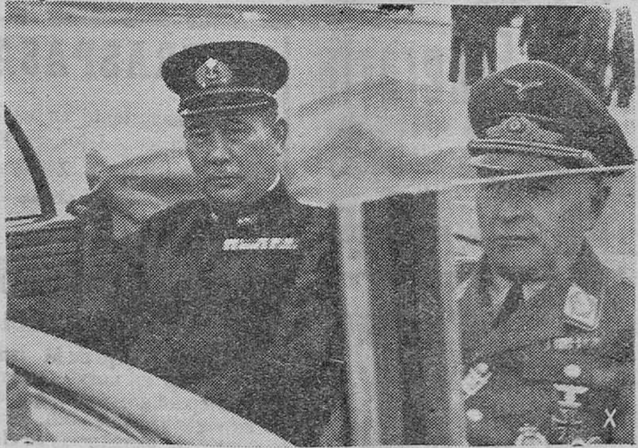
Oficiales japoneses han visitado un aeropuerto de campaña italo-alemán. Un general del arma aérea alemana acompaña a los altos huéspedes durante su visita