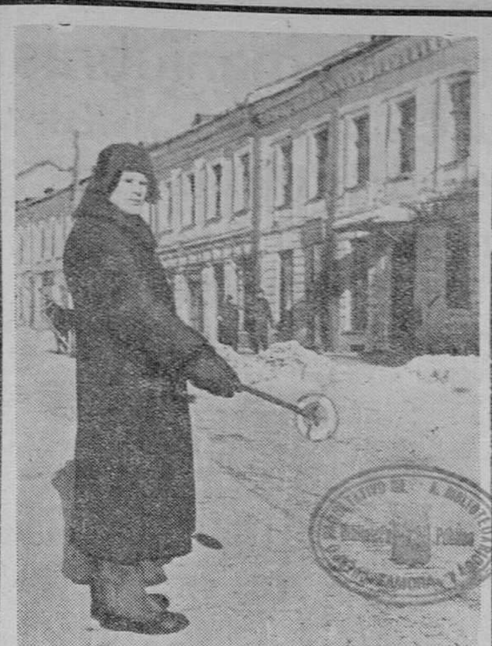
Aspecto de una calle de Pleikau, importante ciudad rusa cerca de Leningrado ocupada por los alemanes. Un habitante desempaña el servicio de guardia del tráfico.