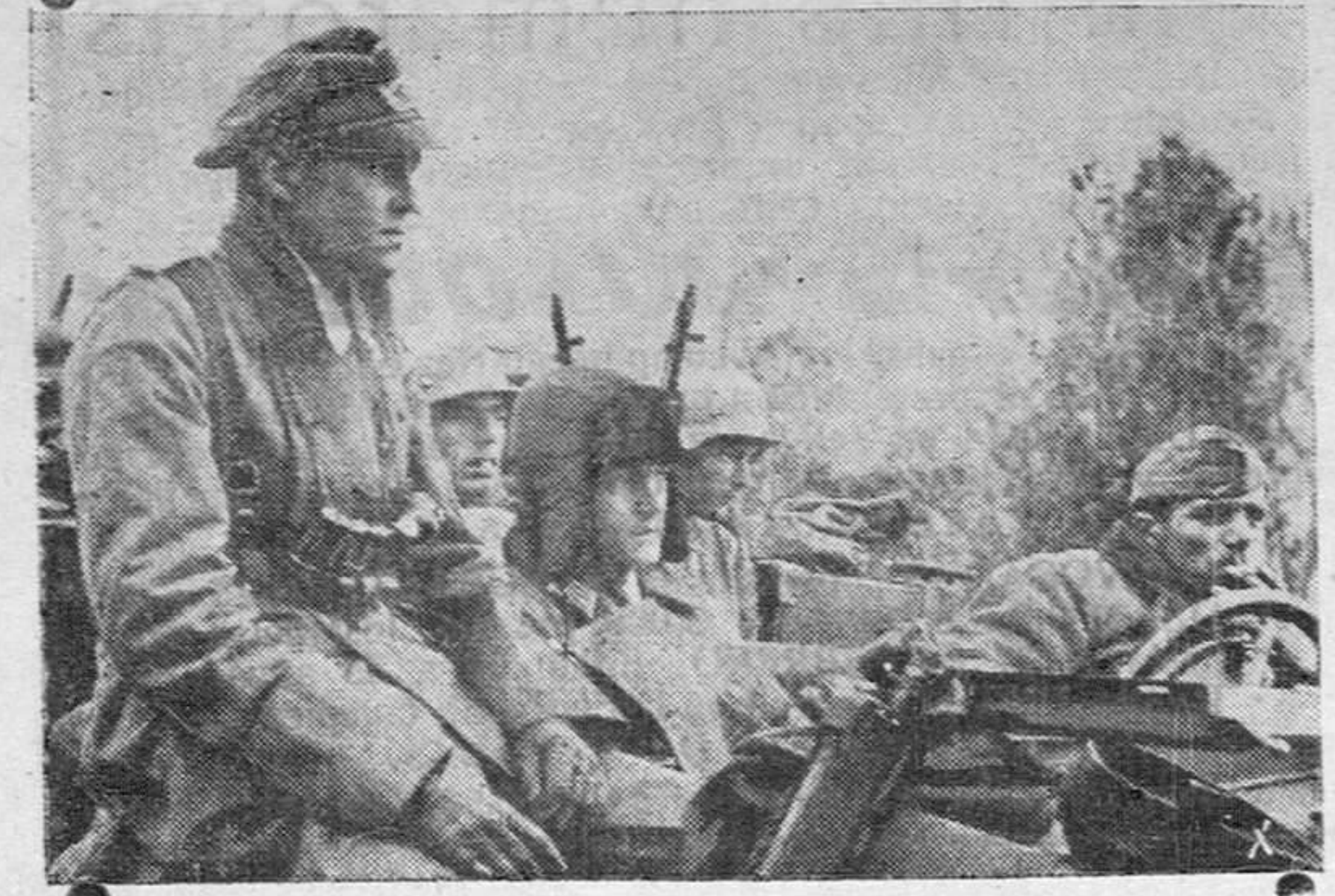
Toda la península de Crimea excepto Sebastopol cuyo cerco se estrecha cada día más, ha sido ocupada por las tropas alemanas que se han fortificado en ella para rechazar cualquier ataque soviético mientras se preparan para la ofensiva decisiva. La foto nos muestra a una patrulla móvil de protección recorriendo su espacio designado.