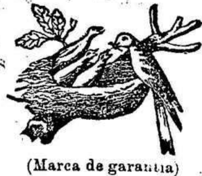
(Marca de garantía)

PROVEEDOR DE LA REAL CASA 32 PREMIO DE LOS CUALES 12 Diplomas de Honor y 14 MEDALLAS DE ORO